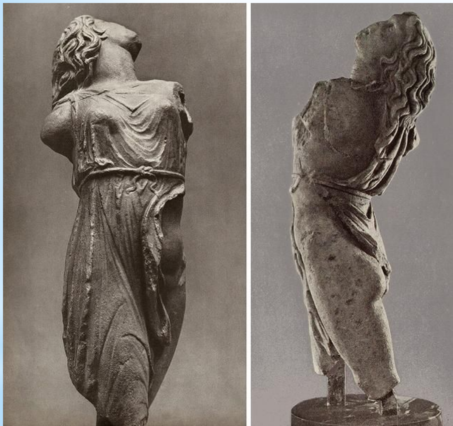
Менада (IV в. до н. э. Римская копия. Дрезден.)

Почти все произведения Скопаса уничтожены временем. Многие работы известны по римским копиям.