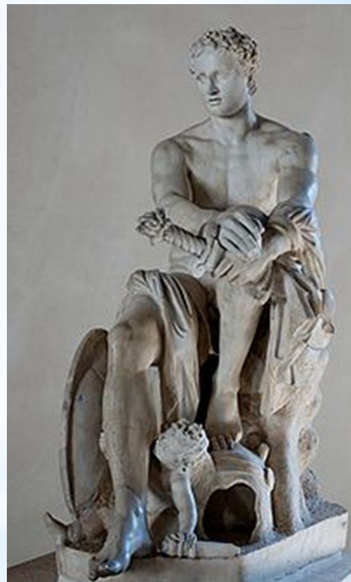
Арес Людовизи — копия с греческого оригинала