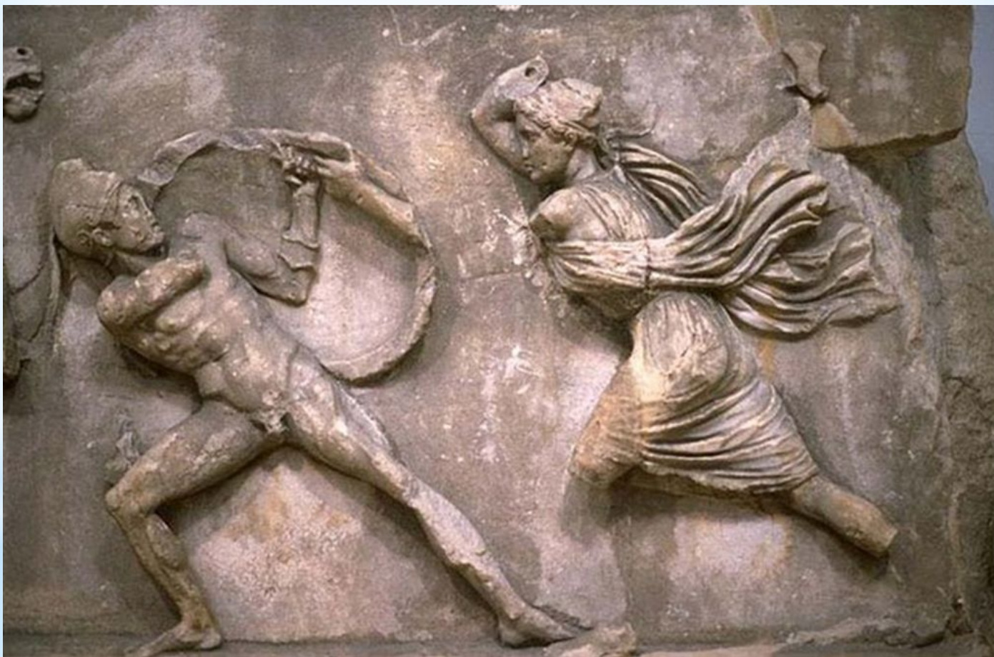
Скопас. Битва греков с амазонками. Британский музей. Лондон.

Среди дошедших до нас произведений Скопаса самым значительным считается фриз мавзолея в Галикарнасе с изображением амазономахии (создан совместно с Бриаксисом, Леохаром и Тимофеем; фрагменты — в Британском музее).