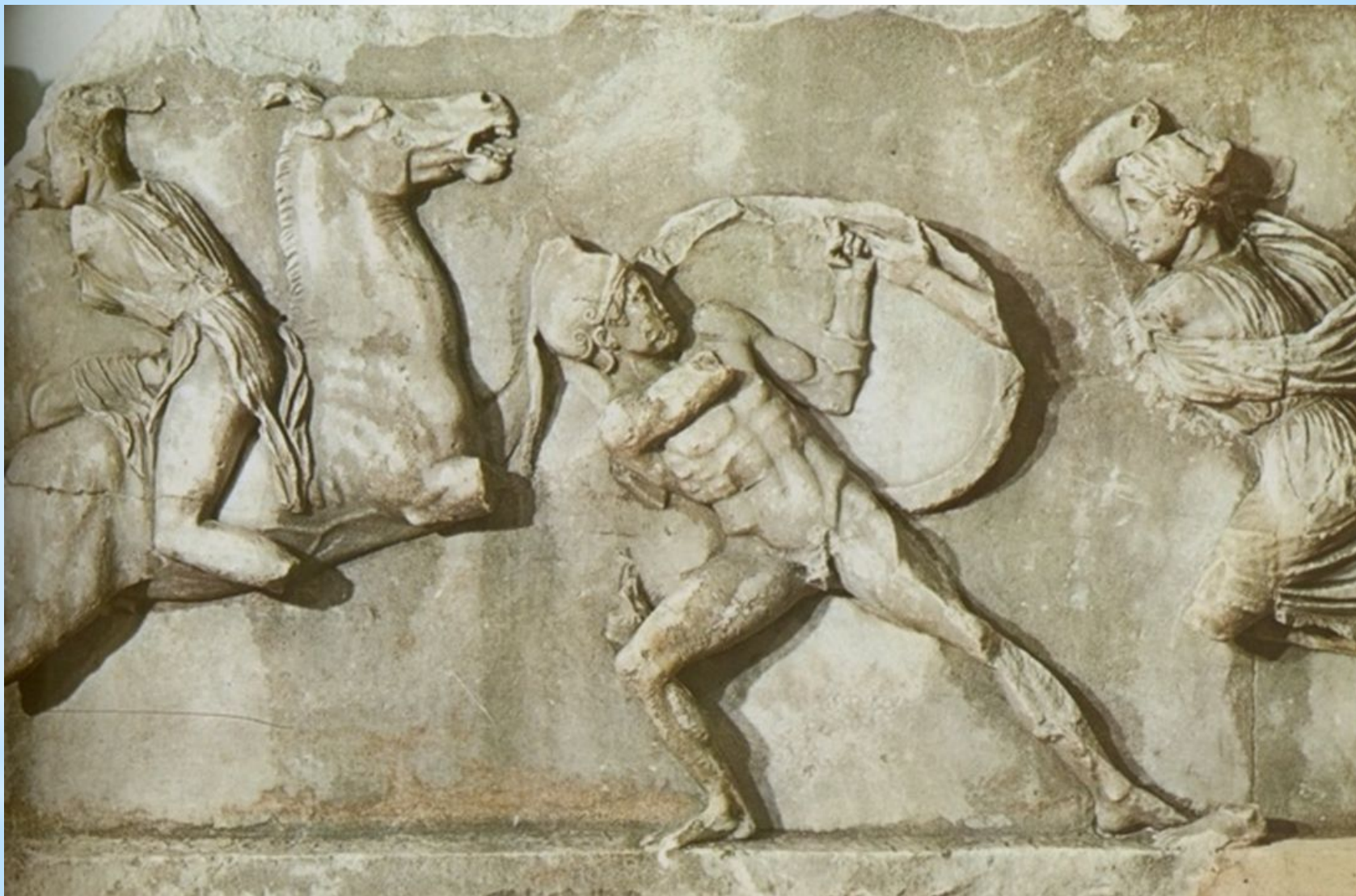
Фрагмент фриза восточной стороны Галикарнасского мавзолея.