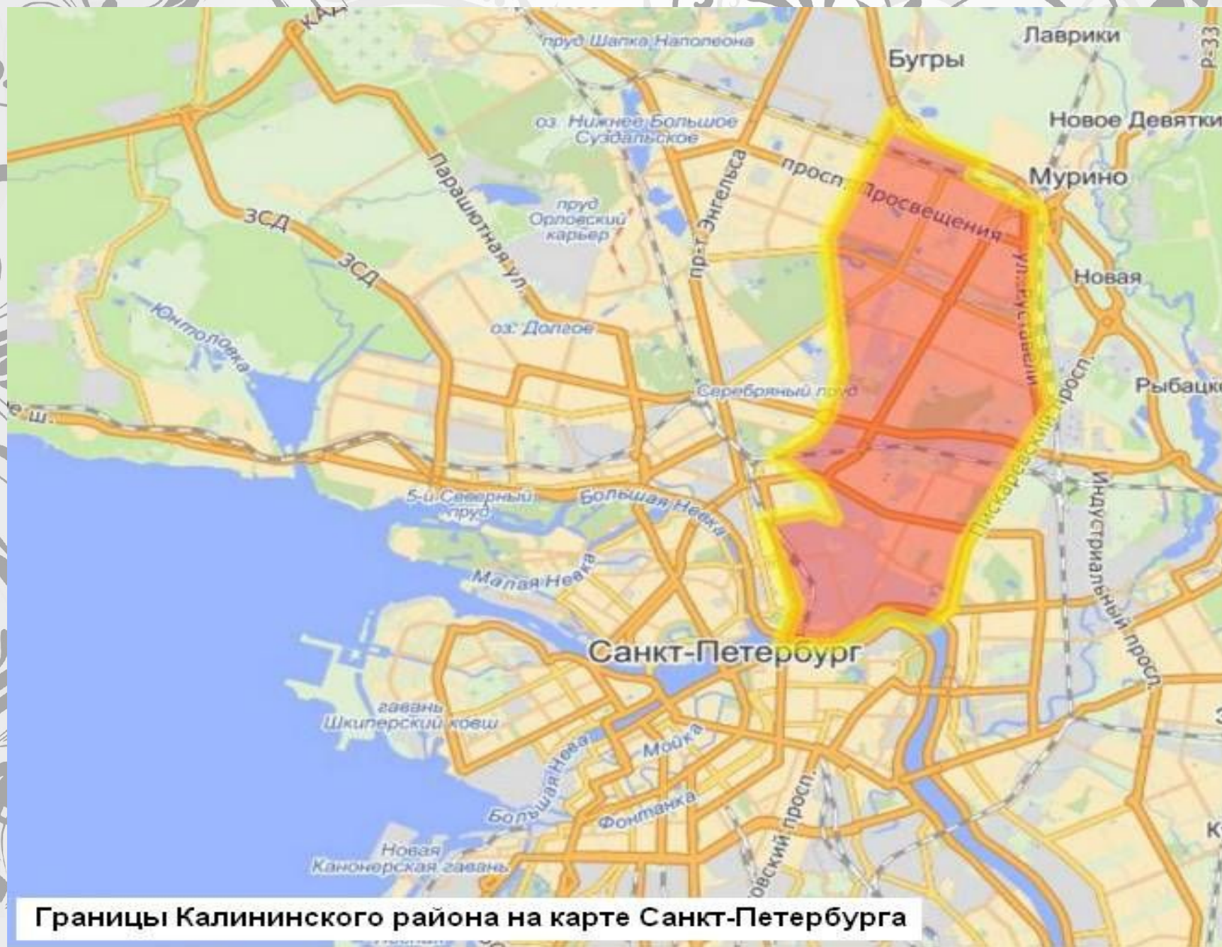
Границы Калининского района на карте Санкт-Петербурга