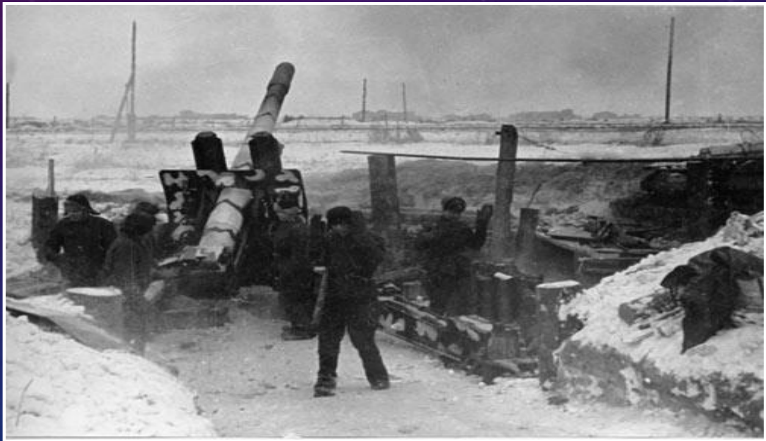
Бой под Ленинградом, зима 1941г.

Мы знаем об этом времени со слов автора :