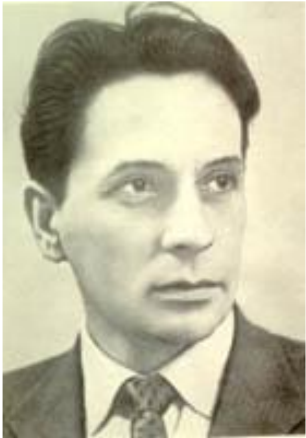
Ф. Абрамов, фото 50 – х годов.