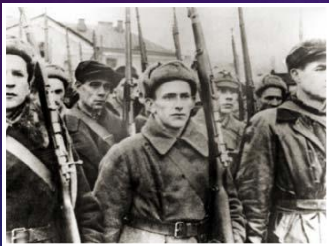
Народное ополчение под Ленинградом, 1941 г.

Она застала Ф. Абрамова на третьем курсе. В день объявления войны он добивался, чтобы у него приняли экзамен, и подал заявление о зачислении его добровольцем в ряды Красной армии.