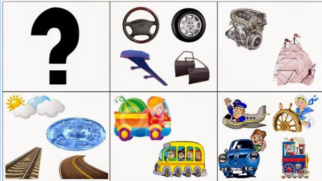
Схема описательного рассказа о транспорте