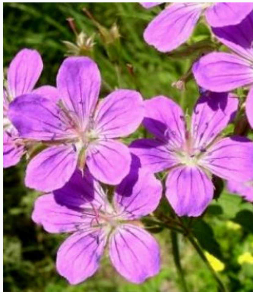
Герань лесная Roseum