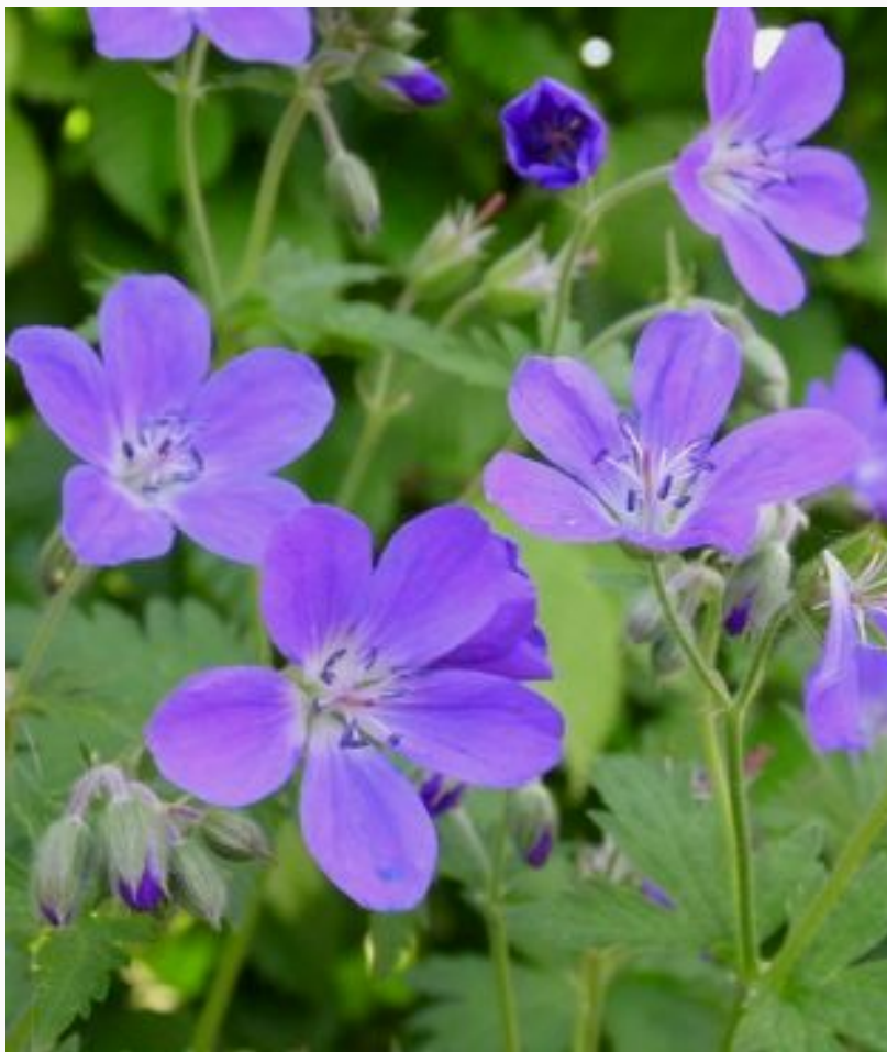
Герань лесная «Майфлауэр»