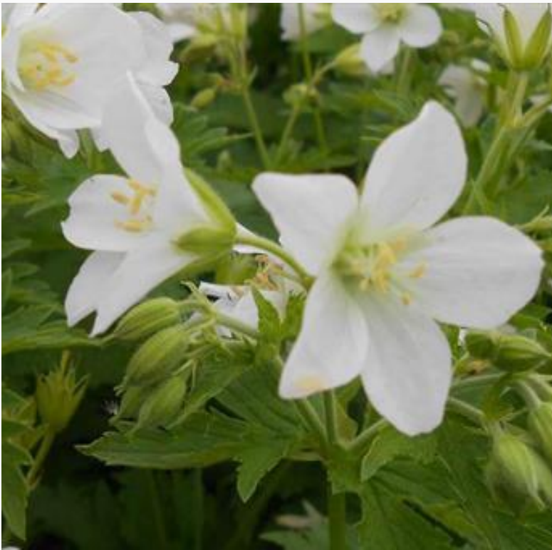
Герань лесная Album