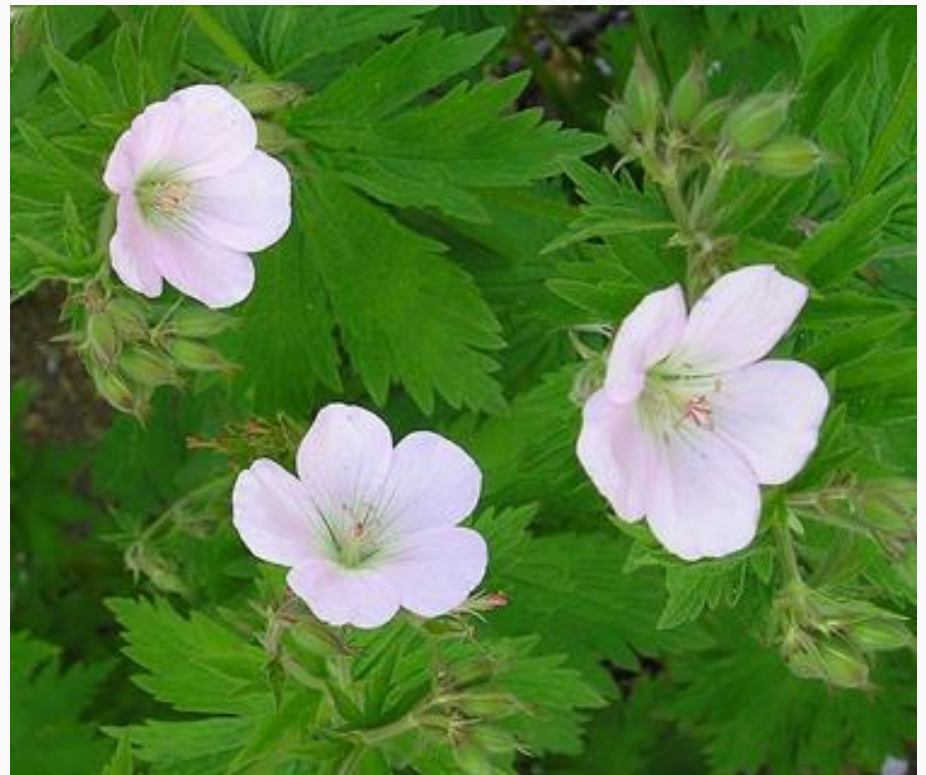
Герань лесная «Baker's Pink»