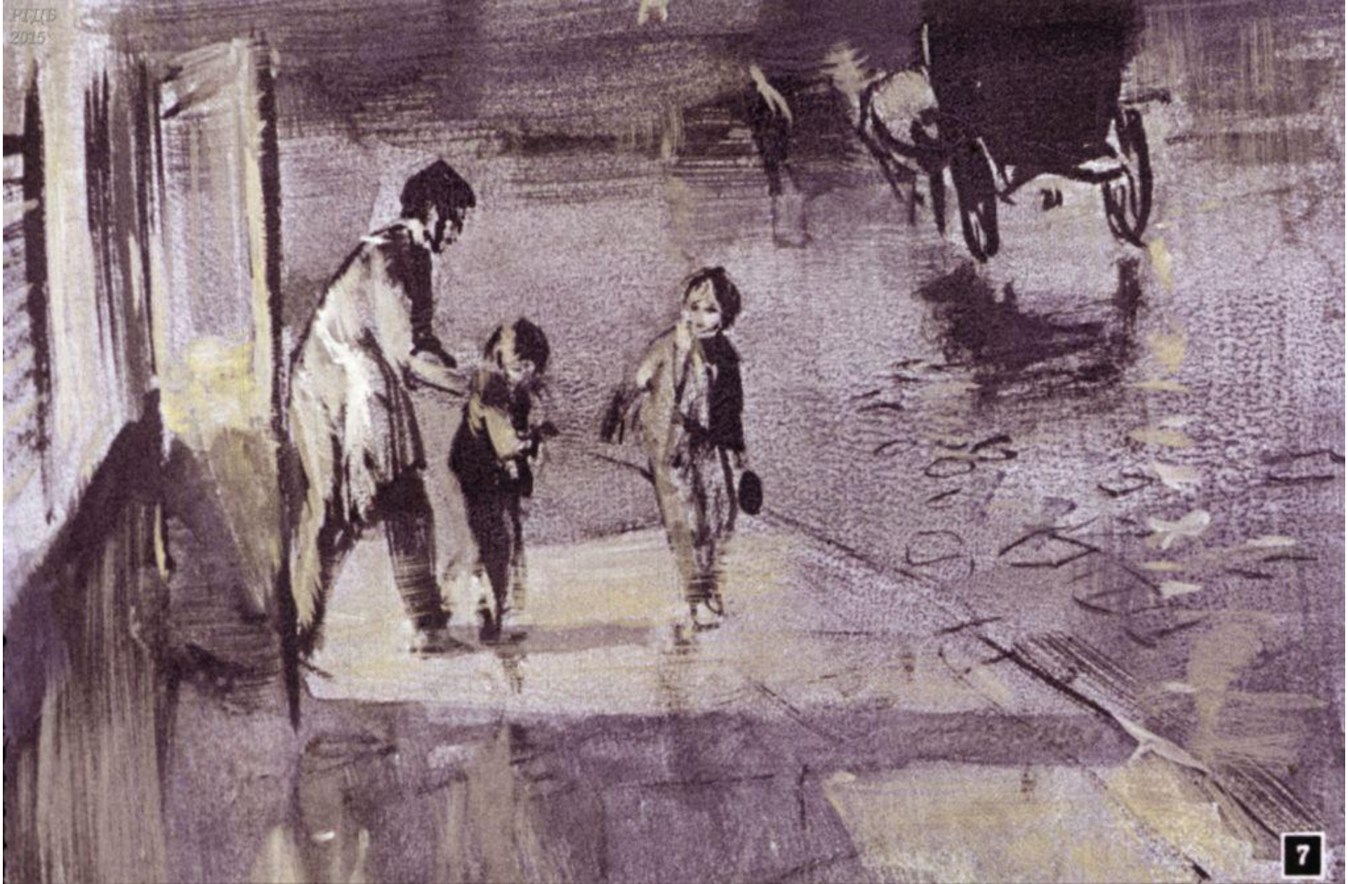
Парикмахер тут же вытолкнул ребят на улицу, крикнув им вслед: „Шатаются зря, только холоду напустили!“