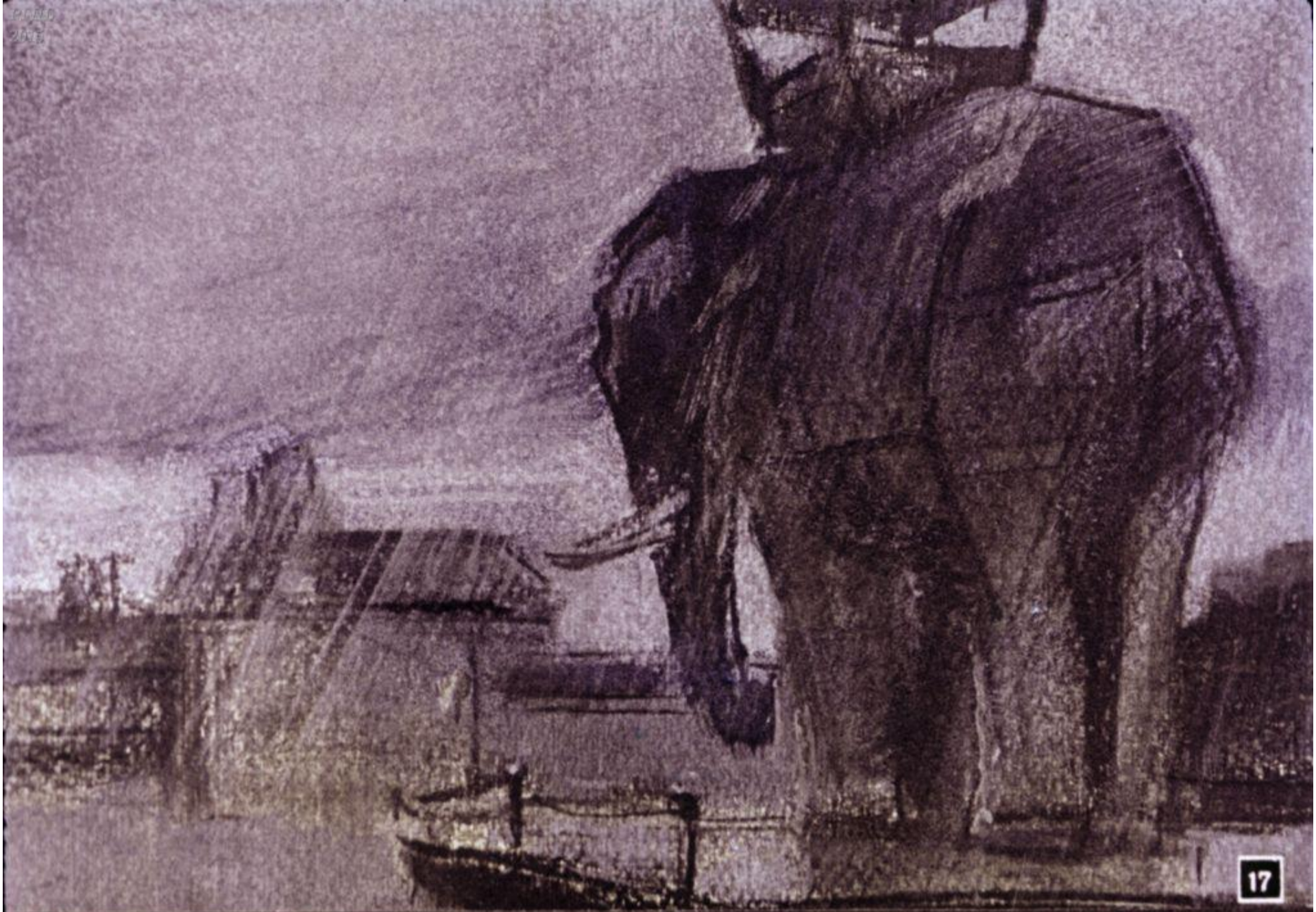
А на дворе бушевала непогода, лил дождь, шумел ветер.