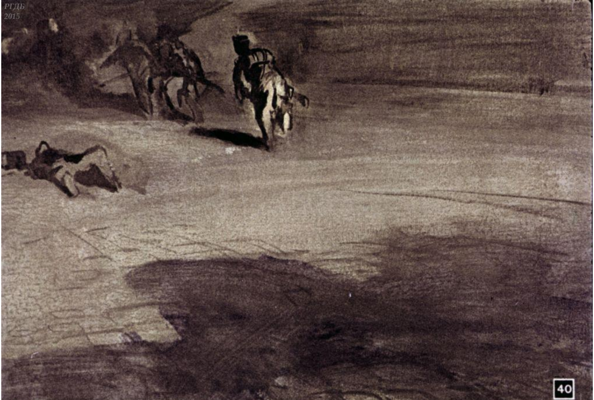
Нападающие в беспорядке и замешательстве отступили.