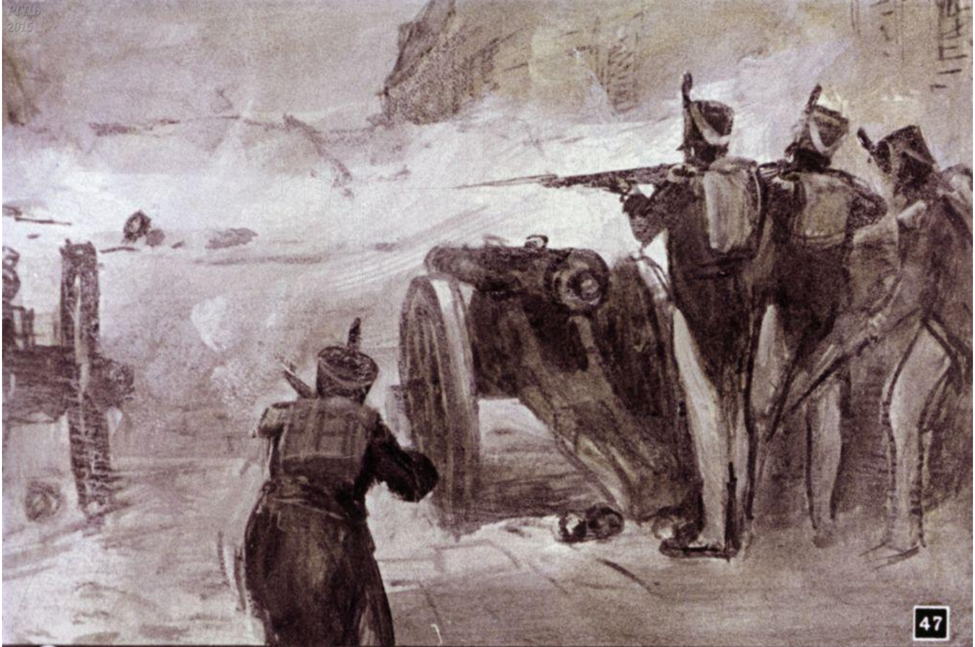
Солдаты заметили какую-то точку, передвигающуюся в дыму, и открыли стрельбу.