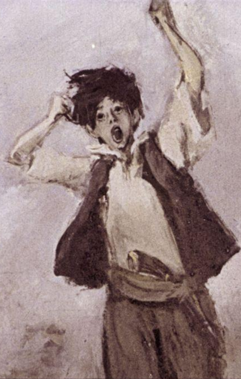
Гаврош приподнялся, поднял обе руки кверху и снова запел.