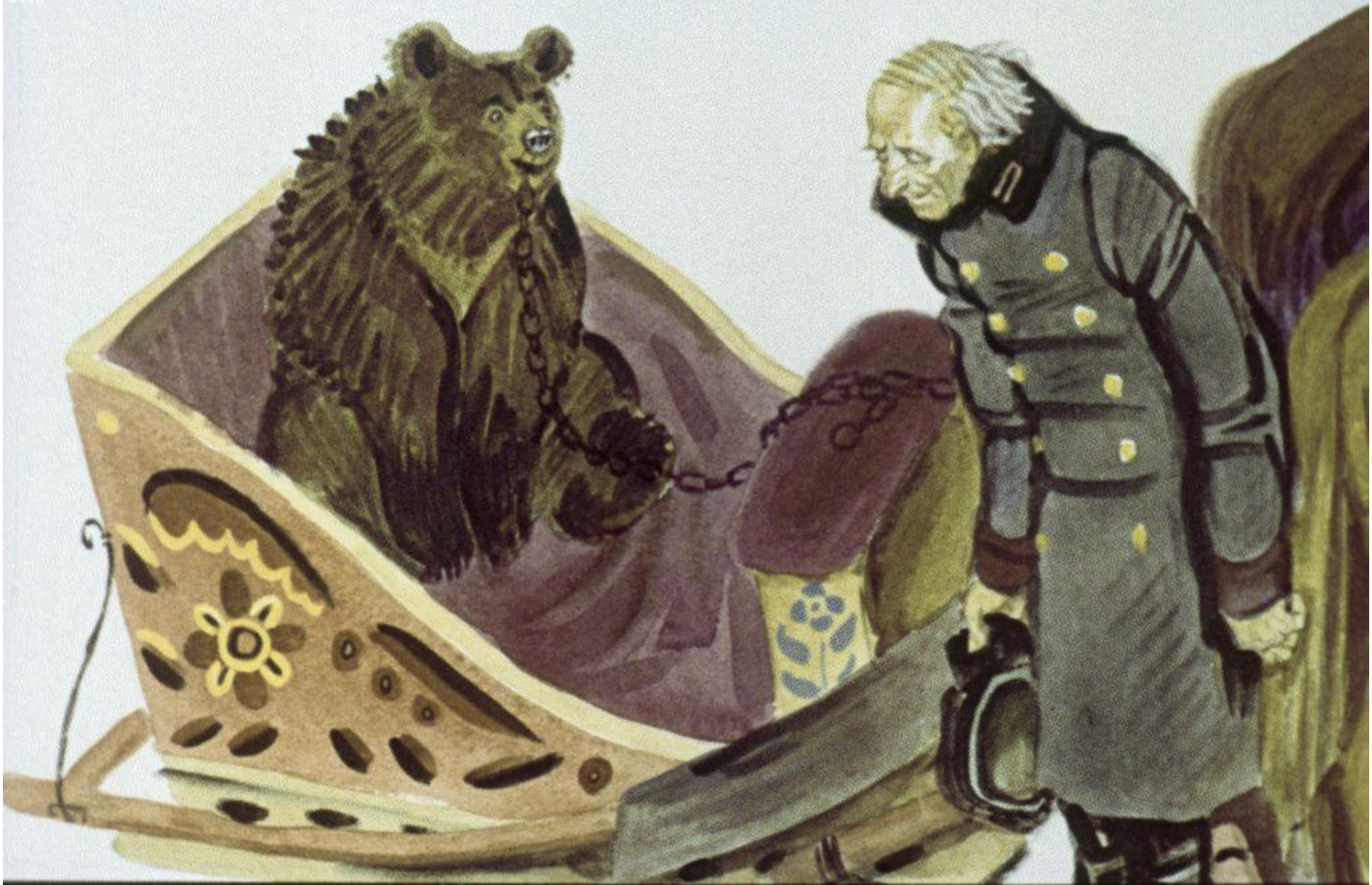
Хочет барину помочь Юркий старичишка;