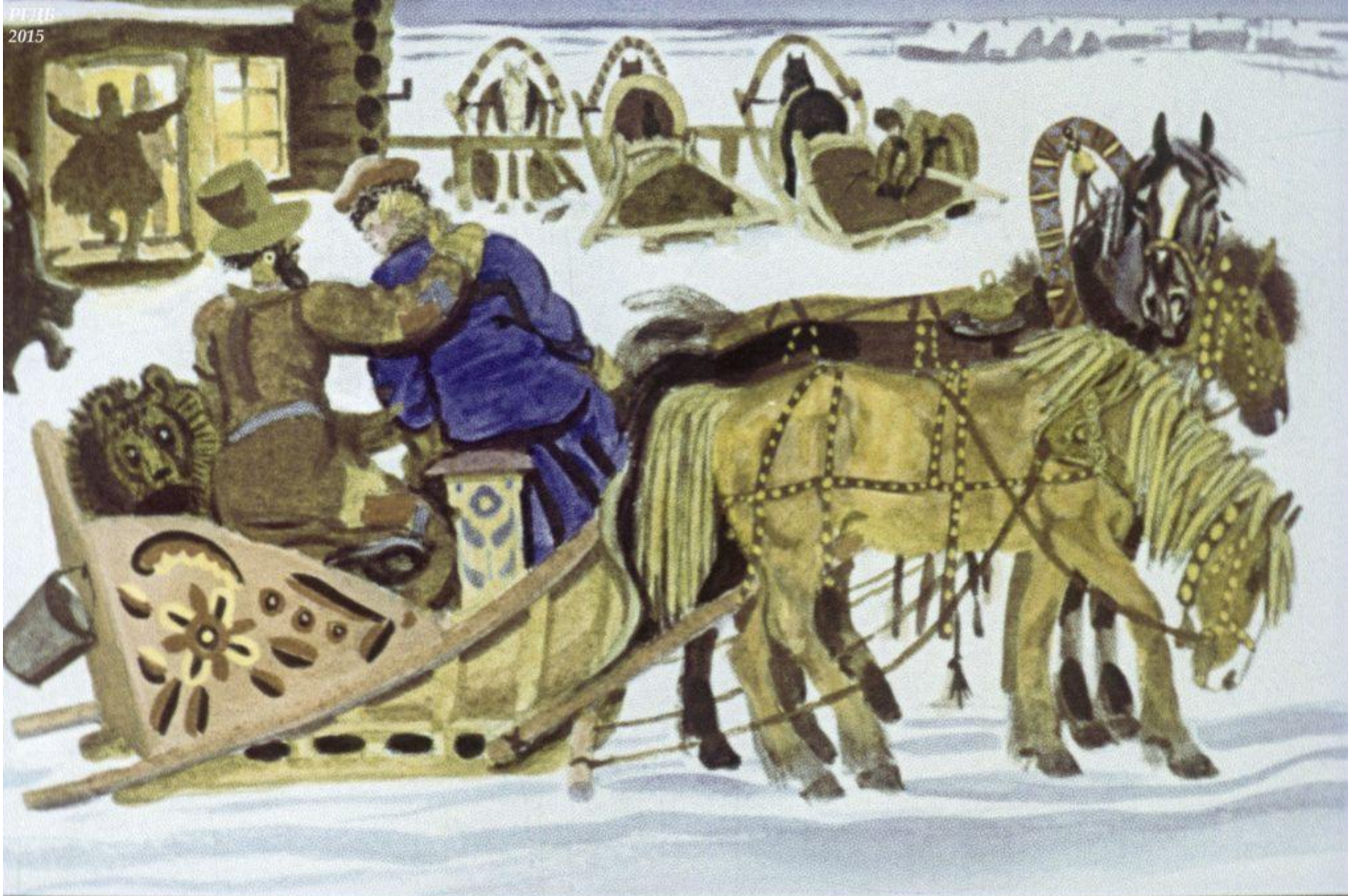
Видит Трифон кабачок, Приглашает Федю.