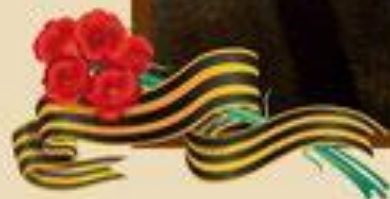
Раскова Марина Михайловна