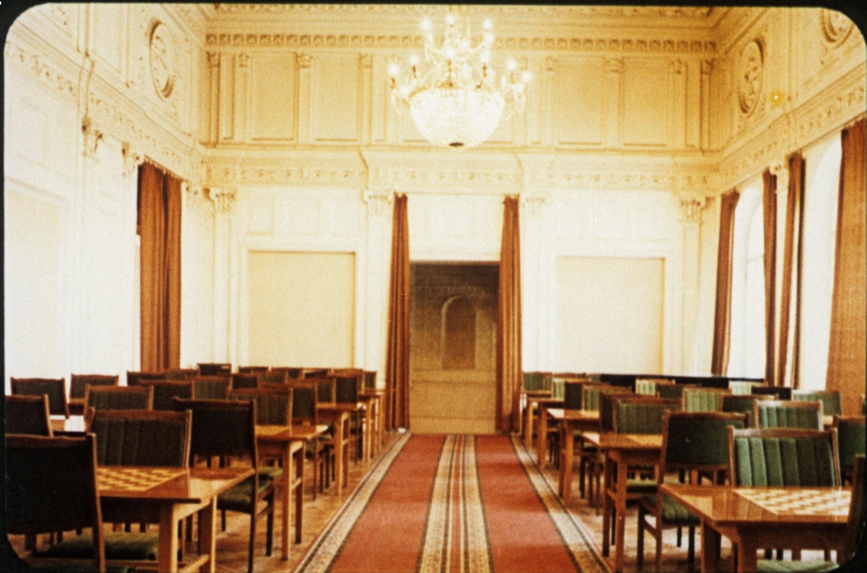
Главный зал клуба.

В 1956 году в нем открылся Центральный шахматный клуб.