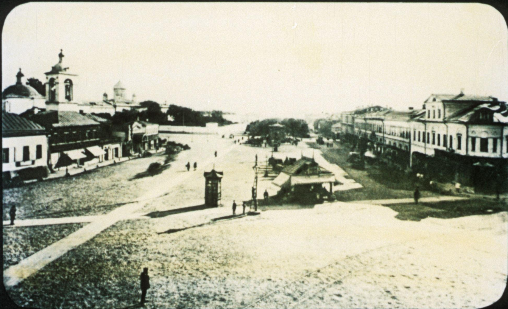
Арбатская площадь. Фото нач. XX века.

«Это одна из пространнейших площадей по бульвару Белого города: входите на оную, и огромность зданий с различными формами архитектуры поражает ваши взоры». Путеводитель 1831 г.