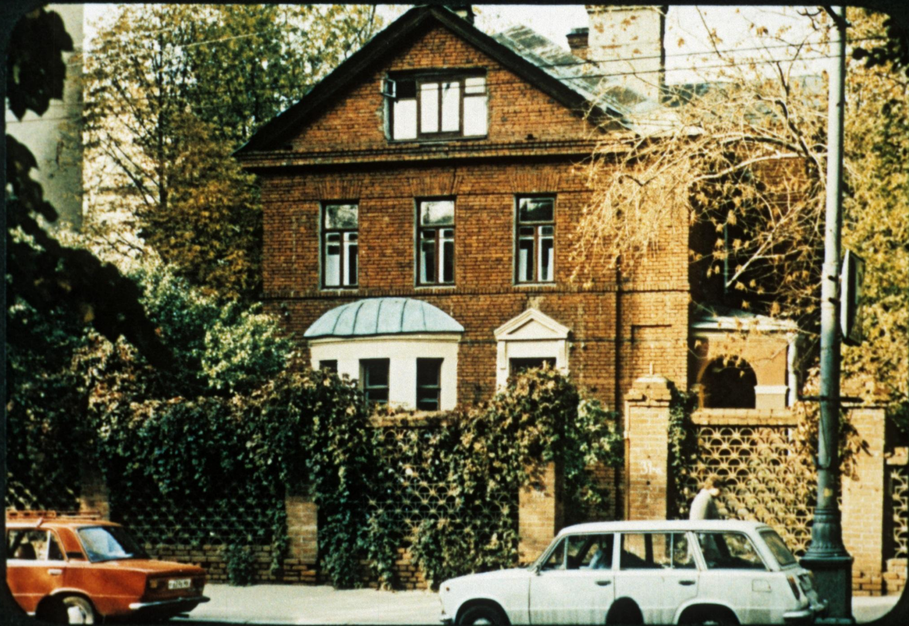
Уютный краснокирпичный особняк с садом построен уже в советское время—в 1926 году.