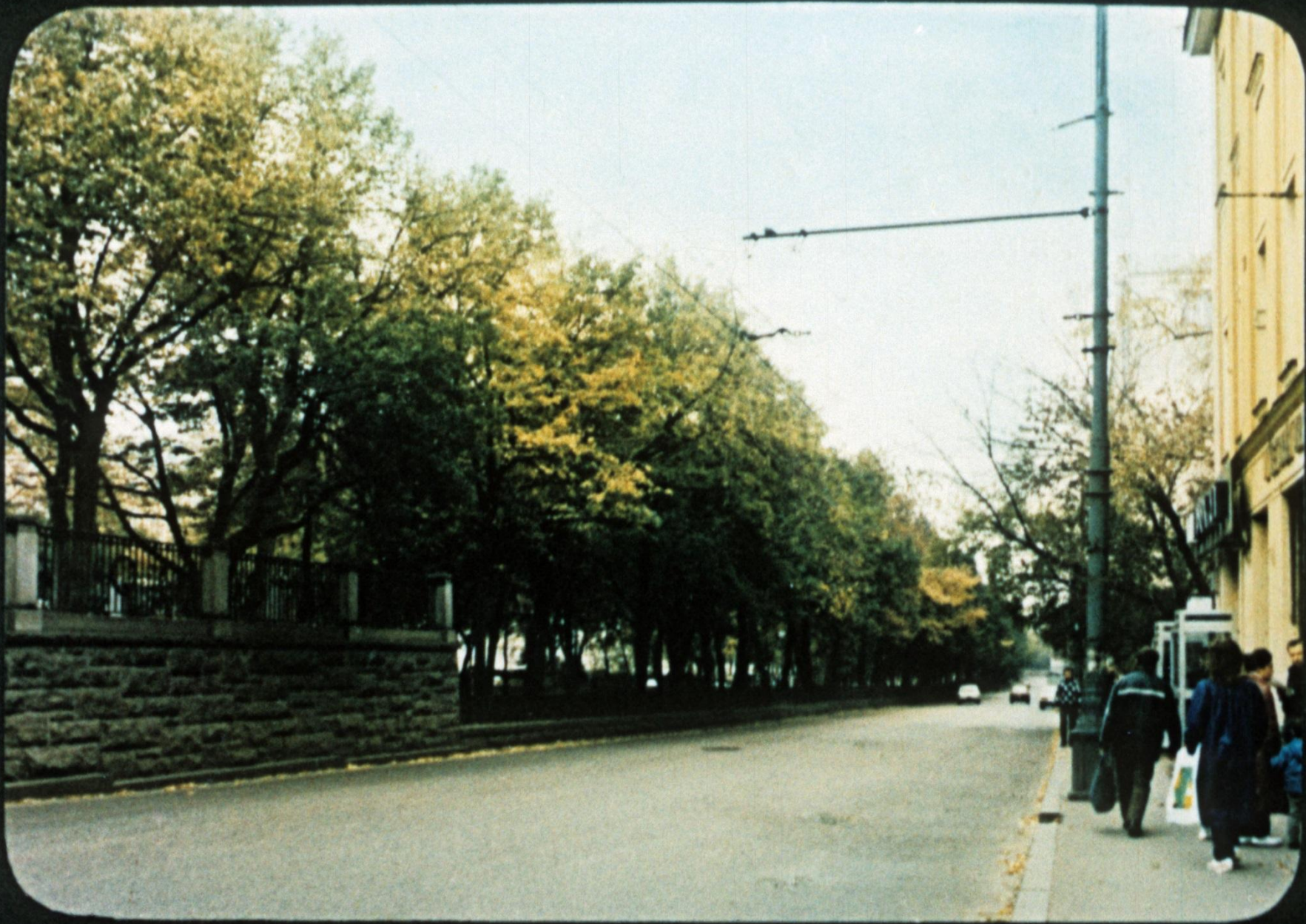
Ныне на месте ручья—обычная московская мостовая.