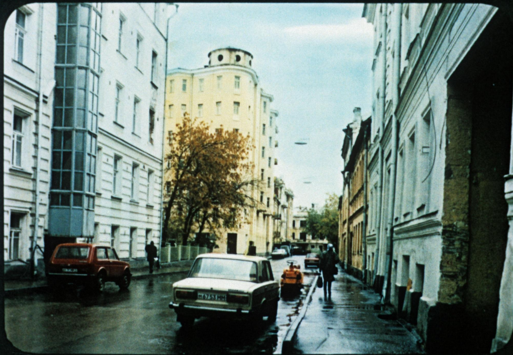
А Малый Афанасьевский переулочек как своим названием, так и обликом характерен для предреволюционной Москвы.