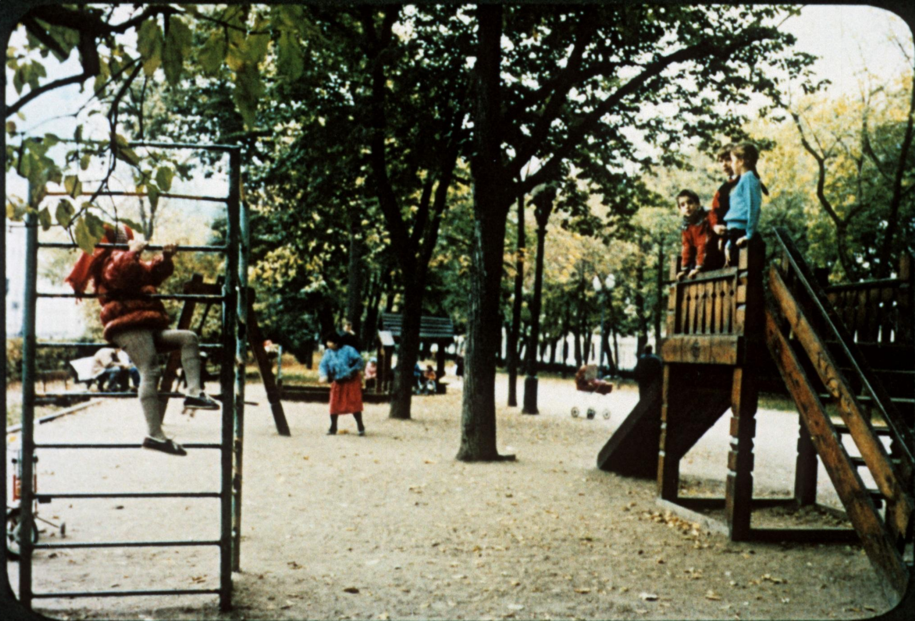
Игровые площадки—для детворы из окрестных кварталов, небогатых зеленью.