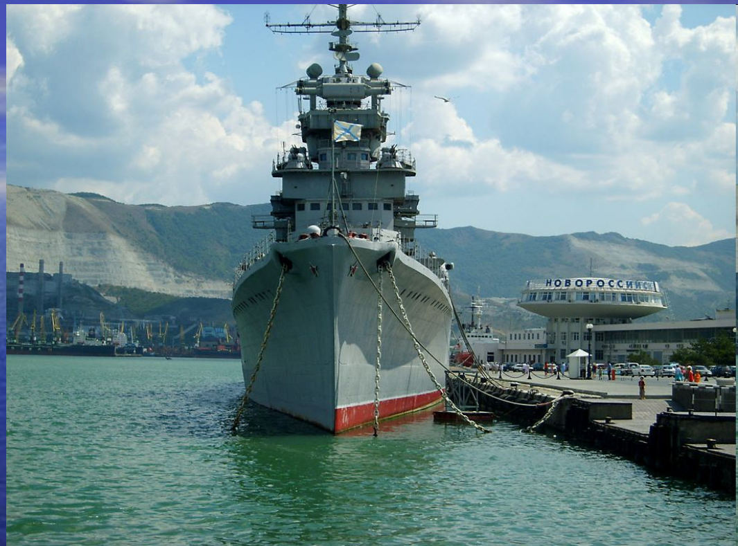
Крейсер Михаил Кутузов