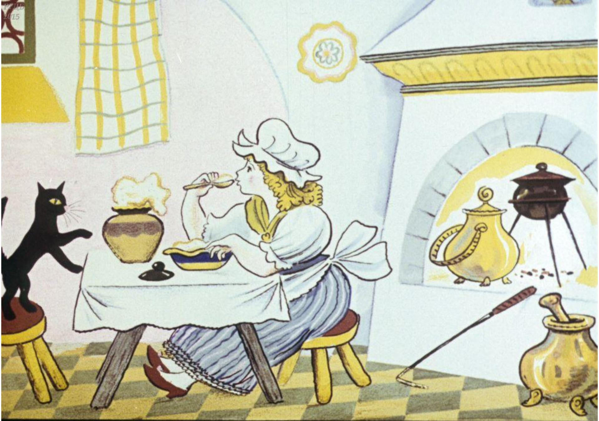
Мать поела, сыта стала.