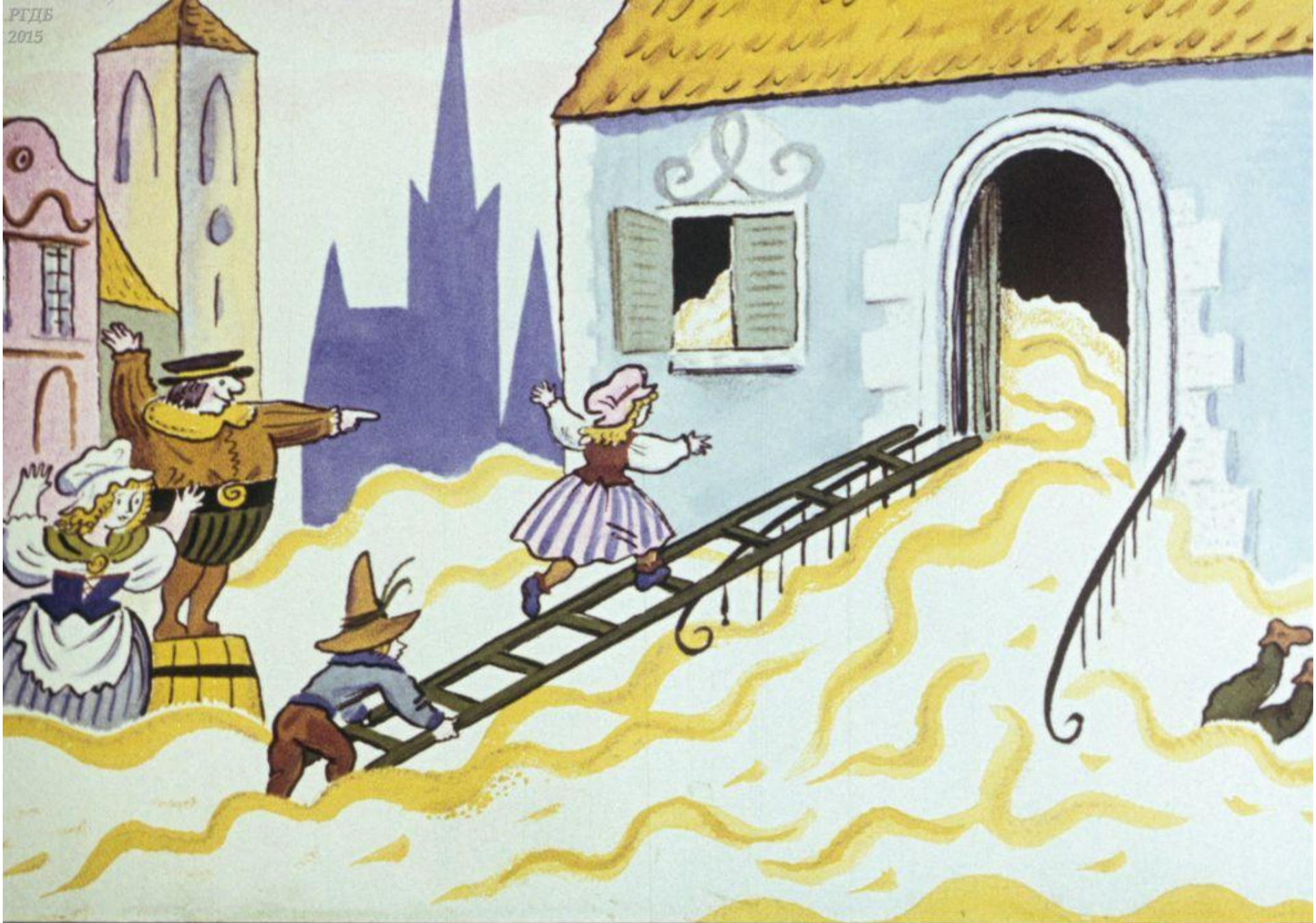
Кое-как взобралась на крылечко