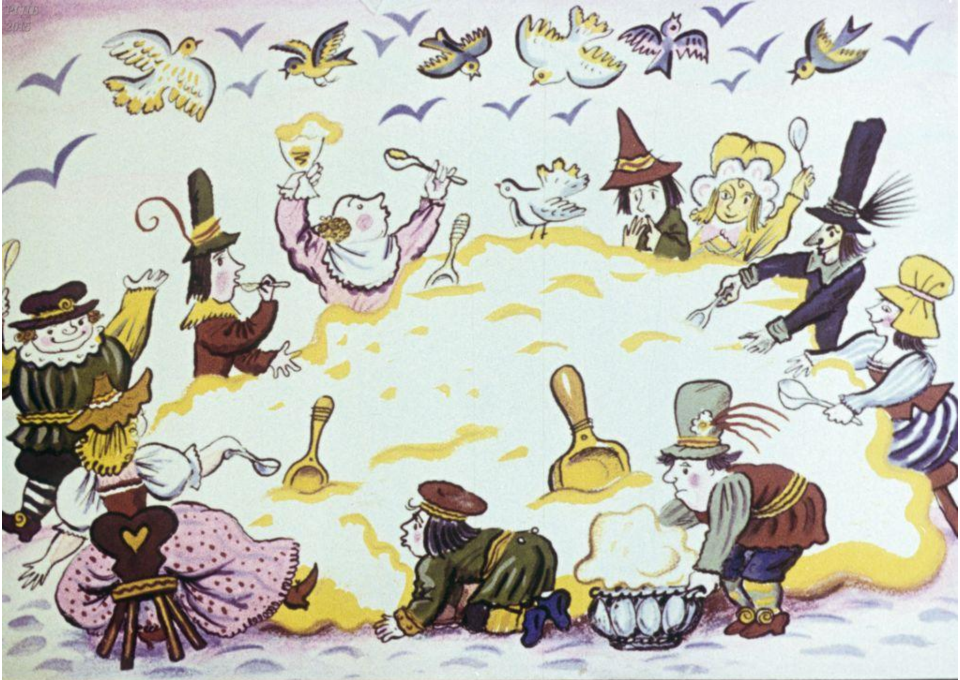
Только никто на это не жаловался...