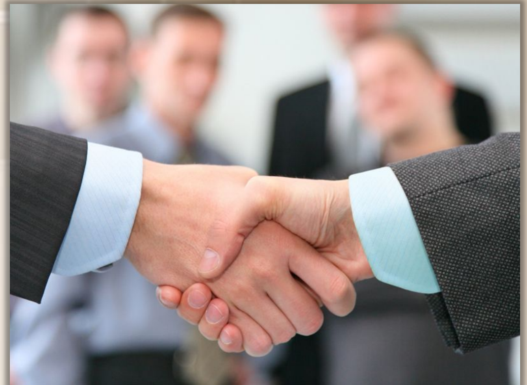
ОТНОСИТЕЛЬНЫЕ (ОГОВОРЕННЫЙ КРУГ ЛИЦ)