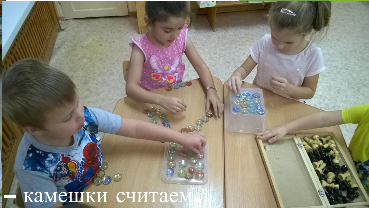
В шашки, шахматы играем. Чудо – камешки считаем.