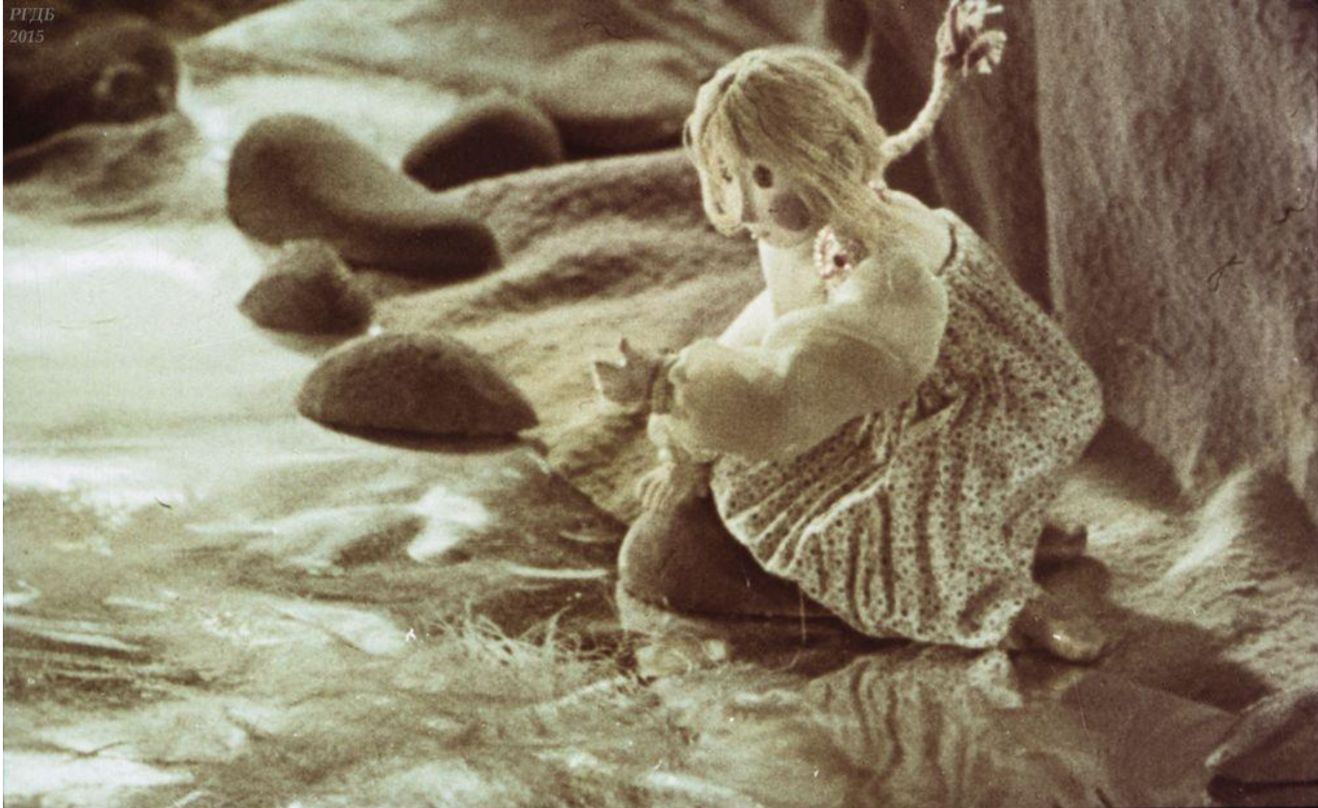
Бежит Маша дальше и видит: течёт молочная речка—кисельные берега. Маша к ней: „Молочная речка—кисельные берега, куда гуси-лебеди полетели?“