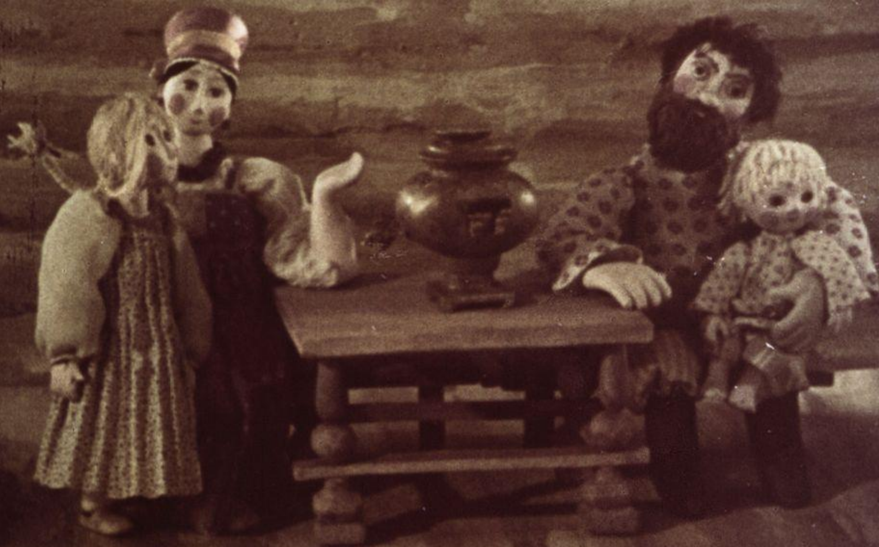
Жили-были муж да жена. Были у них дочка Ма- шенька да сын Ванюшка.