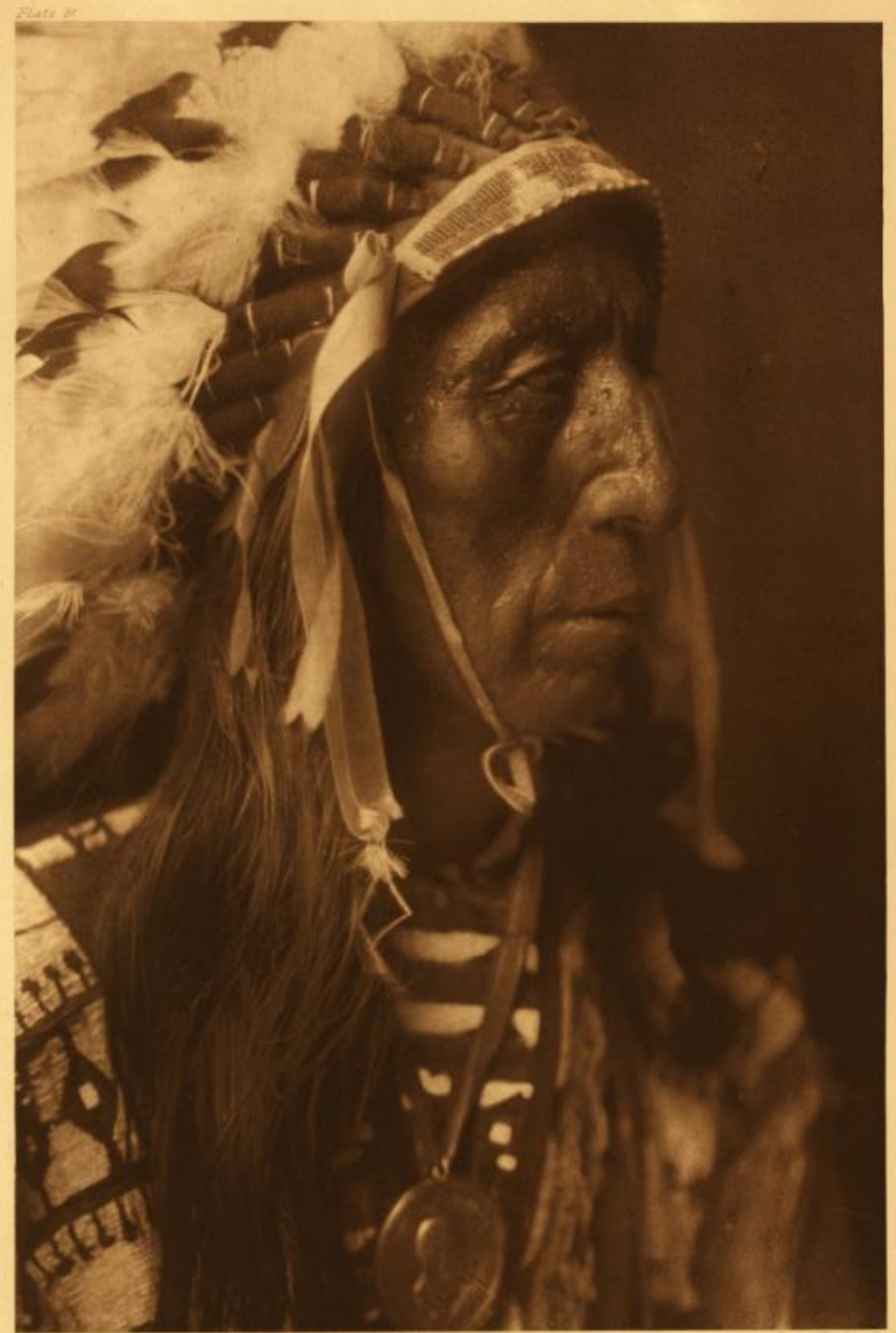
JACK RED CLOUD

За долгие годы индейские племена освоили множество культур. В то же время оказали огромное влияние на культуру американцев.