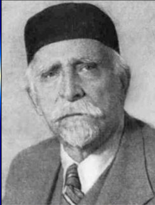
Николай Дмитриевич Зелинский (1861-1953)

В июне 1915 года Н.Д. Зелинский работал в то время в Петрограде заведующим Центральной лабораторией Министерства финансов, где ему и пришла мысль использовать уголь для защиты от газов. Соприкасаясь по роду своей деятельности с производством спирта, в котором уголь с давних пор применялся для очистки сырца, Н.Д. Зелинский имел в своем распоряжении различные сорта углей и, поставив соответствующие опыты, обнаружил, что уголь действительно является мощным средством для поглощения ядовитых газов.