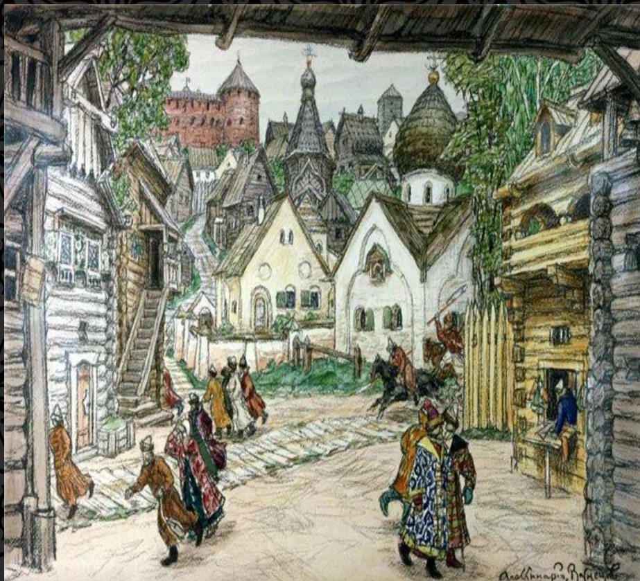
А. Васнецов «Опричники едут»