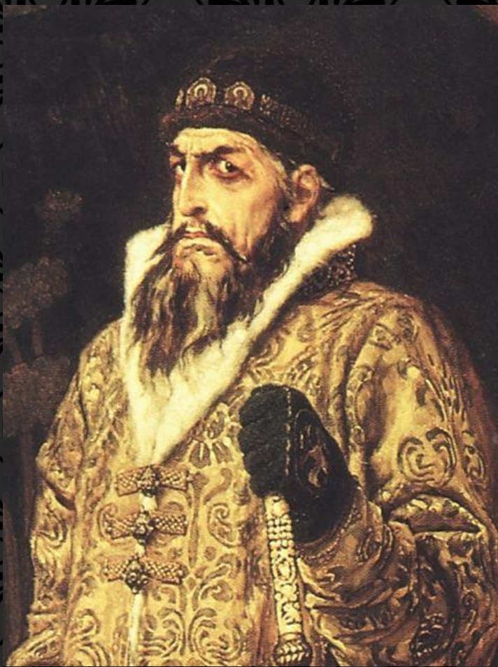
В.М. Васнецов «Иван IV»