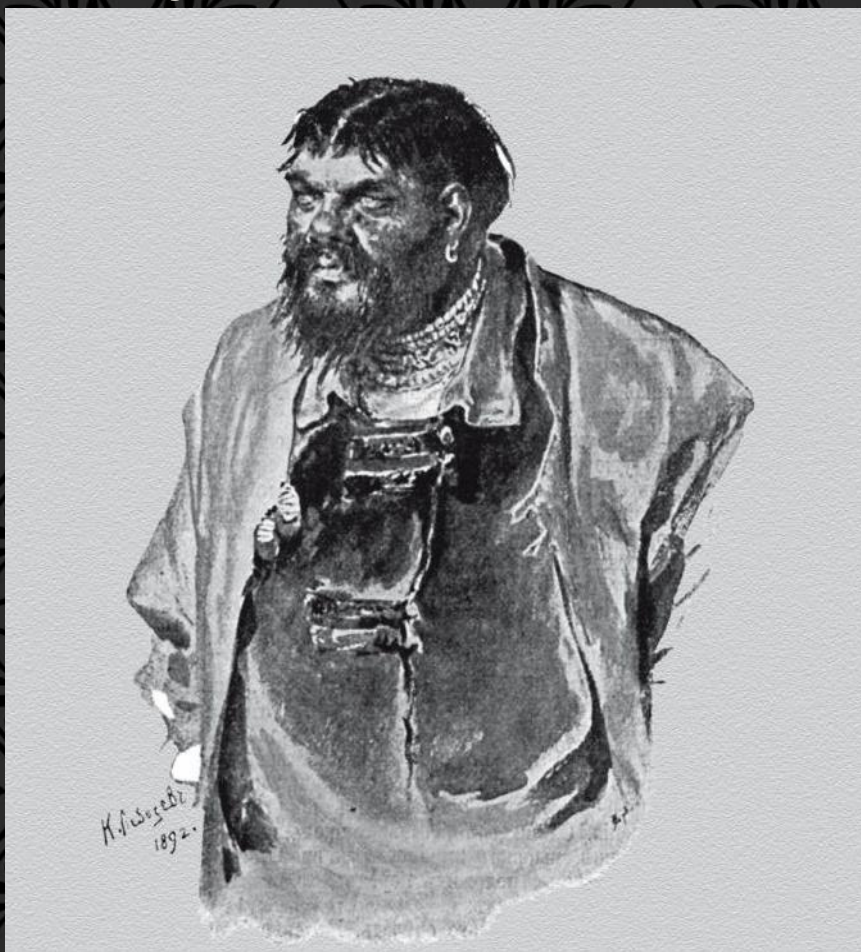
Глава опричников – Малюта Скуратов (автор Лебедев К.В.)