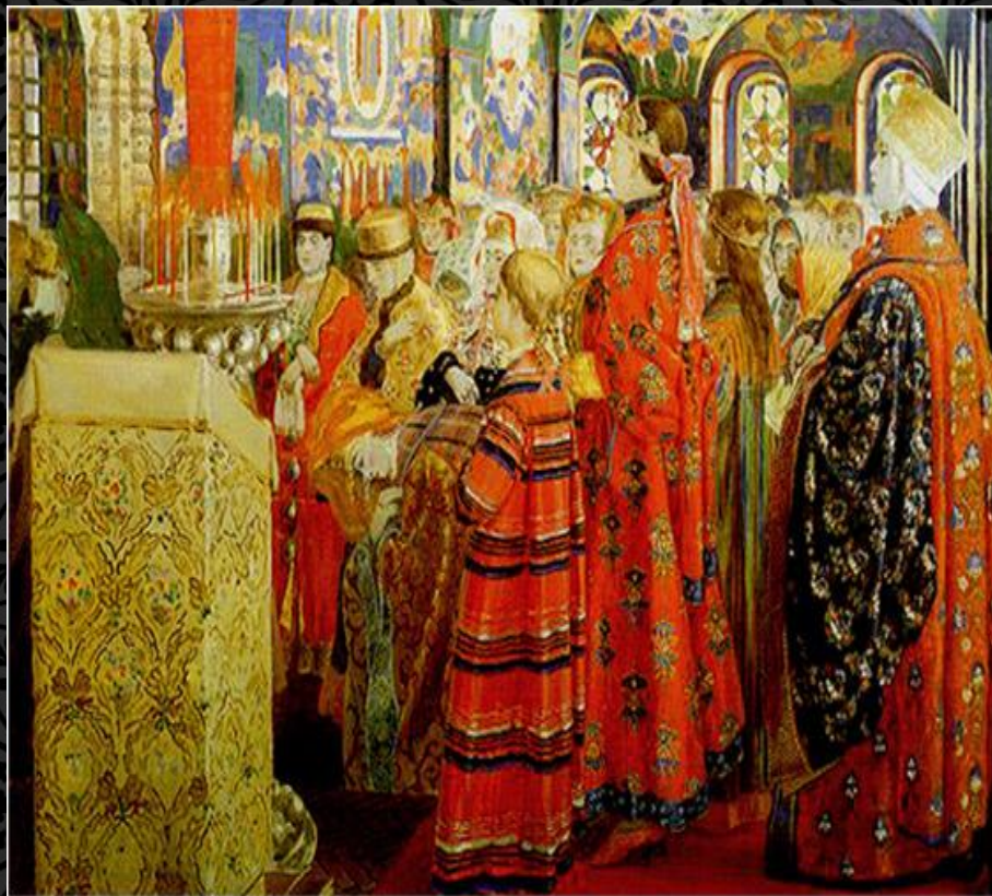
Женщины в церкви