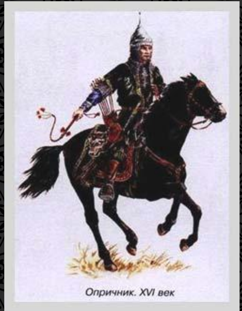
Опричник. XVI век

К сёдлам опричников привязывались метла (символ того, что выметают измену) и пёсья голова (символ того, что выгрызают врагов царя).