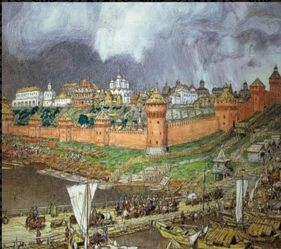
Московский Кремль при Иване 3