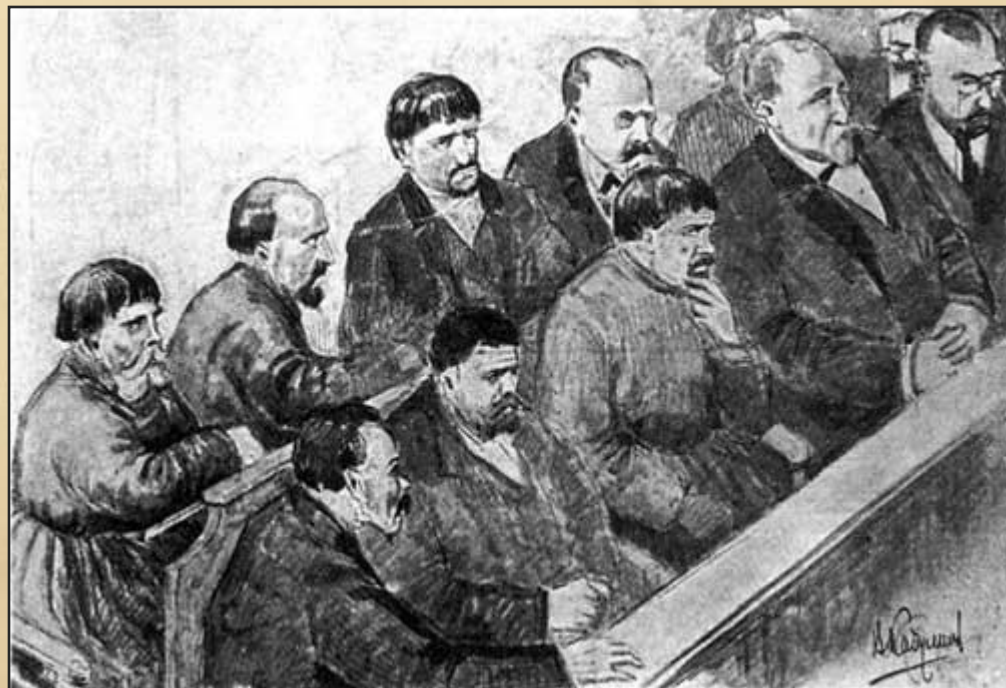
Присяжные. Рисунок из газеты, 1912 г.

Оправдательным приговором снимался арест с 23-го номера, приостановленное издание газеты «Юг Тобола» могло быть продолжено