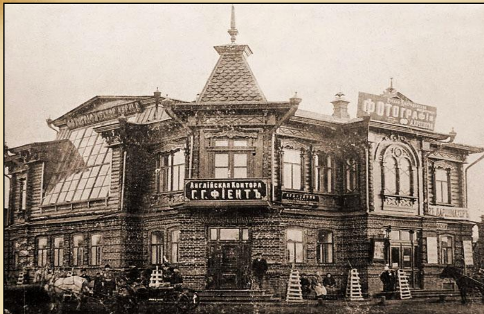
Типография А.И. Кочешева, где печатался «Юг Тобола» с 1 июля 1912 г.