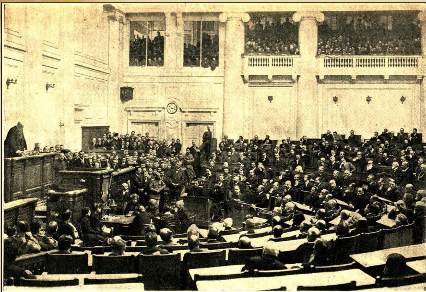
Государственная Дума. Фото из газеты, 1912 г.