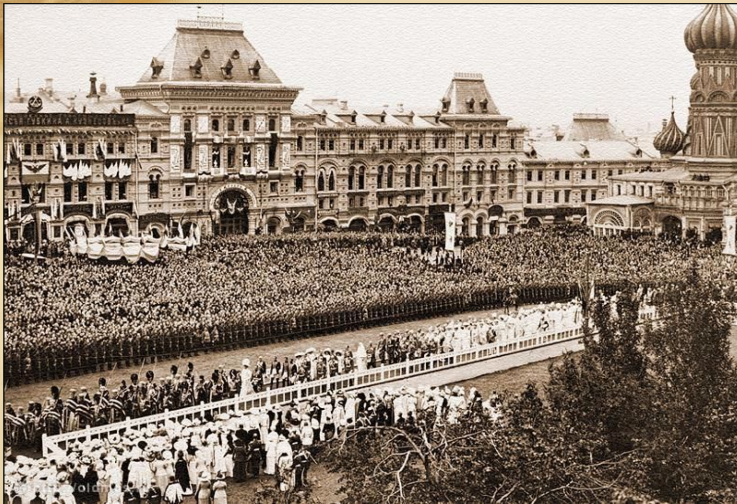
Торжества на Красной площади в честь 100-летия Бородинского сражения. Фото из газеты. 1912 г.