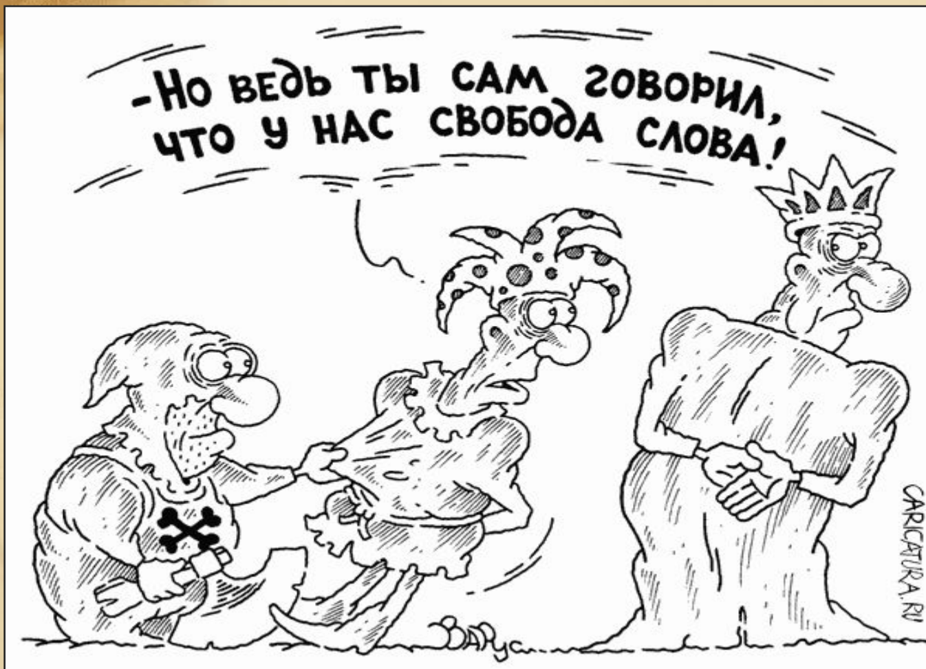
Царская цензура. Карикатура середины XX века.