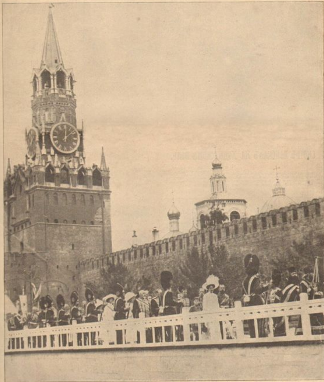
Фото из газеты, 1912 г.