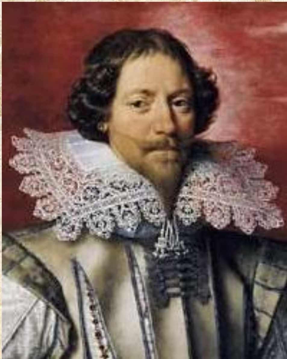
Король Карл V