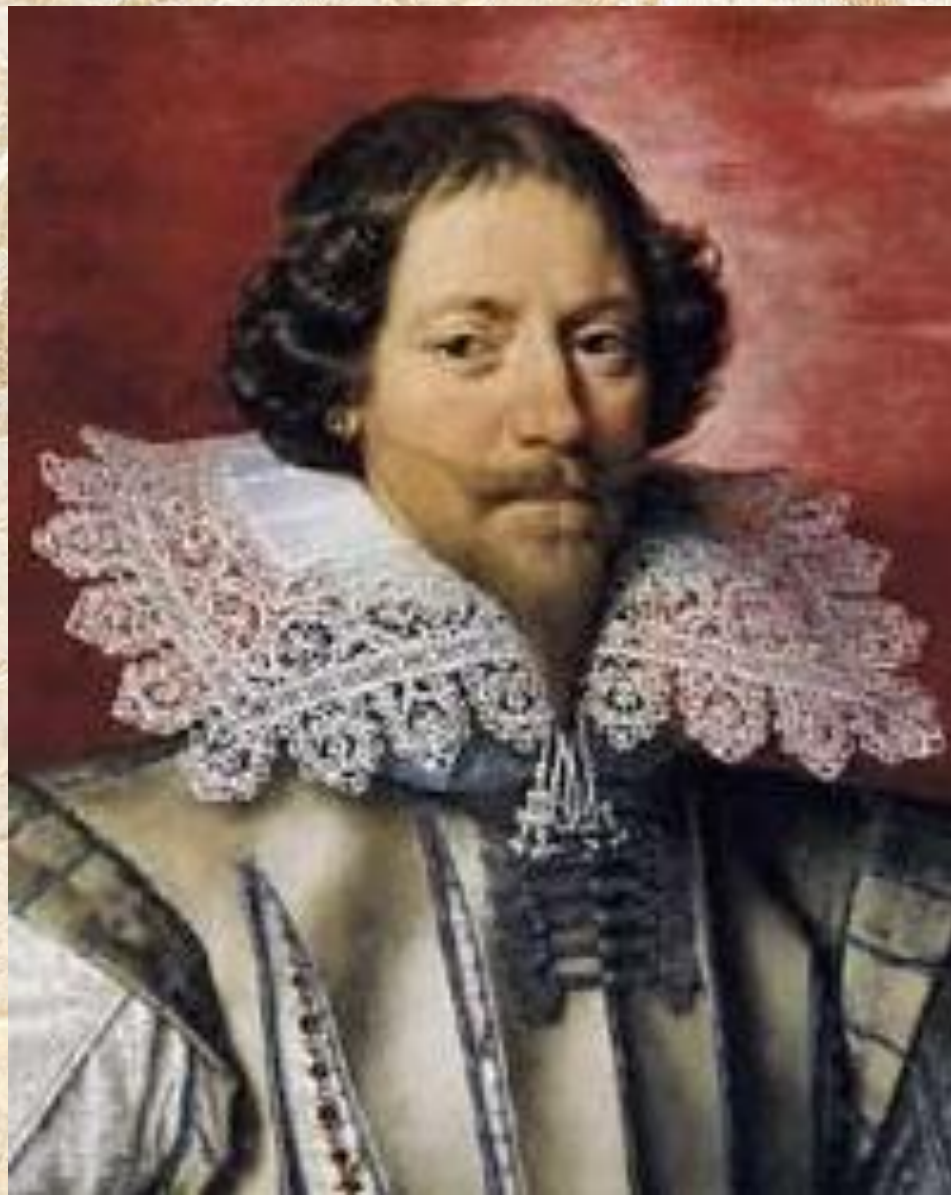
Король Карл V