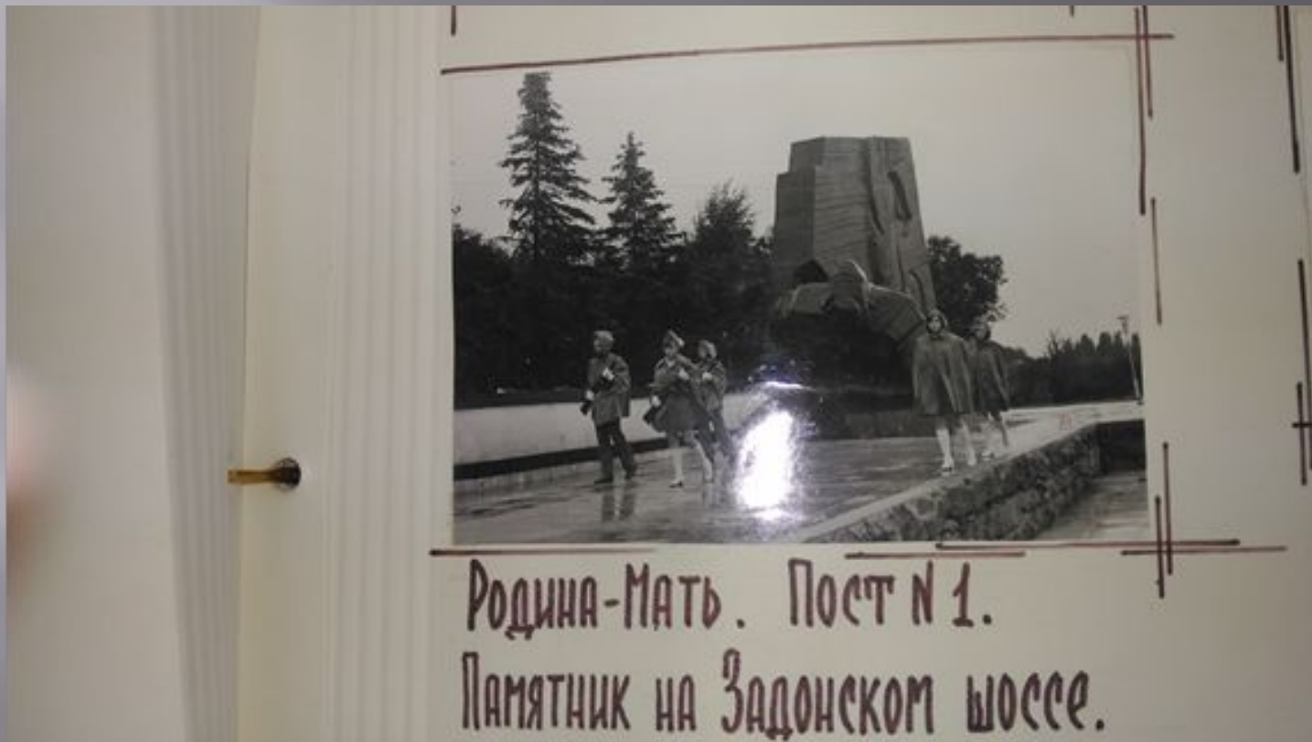
Родина-Мать. Пост № 1. Памятник на Задонском шоссе.