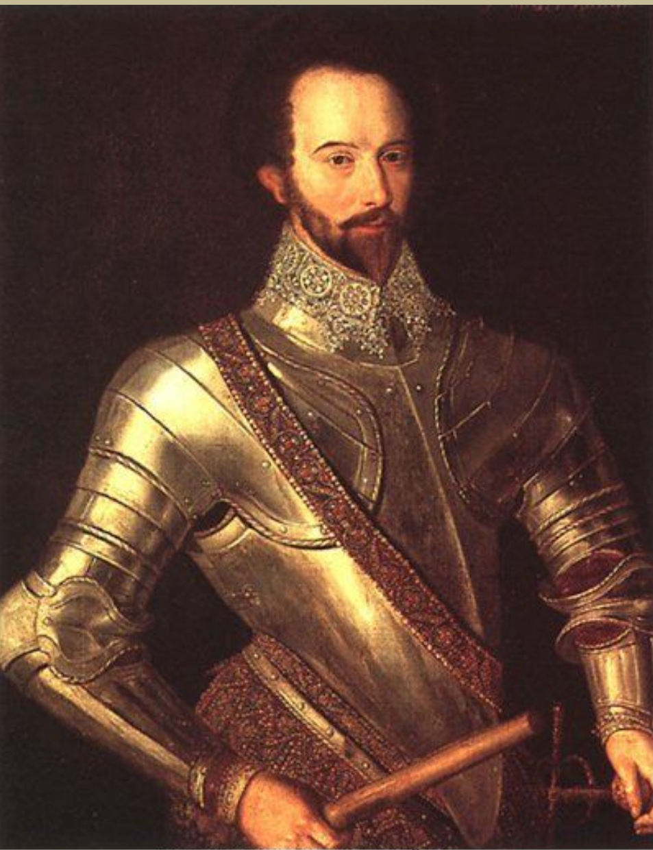
Портрет сэра Уолтера Рэйли.