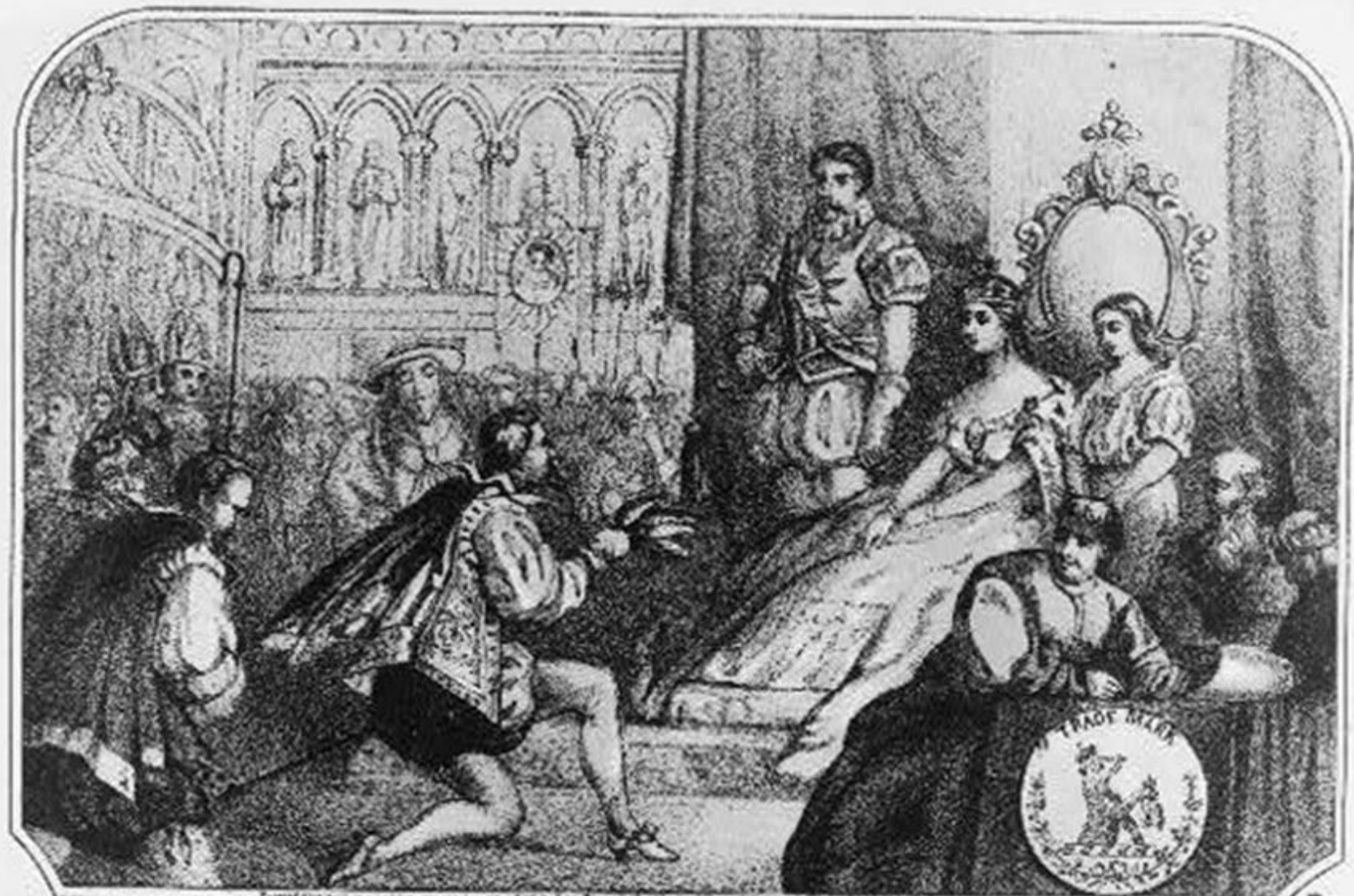
JEAN BODI PRINCE OF THE TODAY PLAN TO GUERRA CAT CRIME DE MERITO AND THE GRAND PRINCE OF THE HOUSE OF LORRAINE 1844