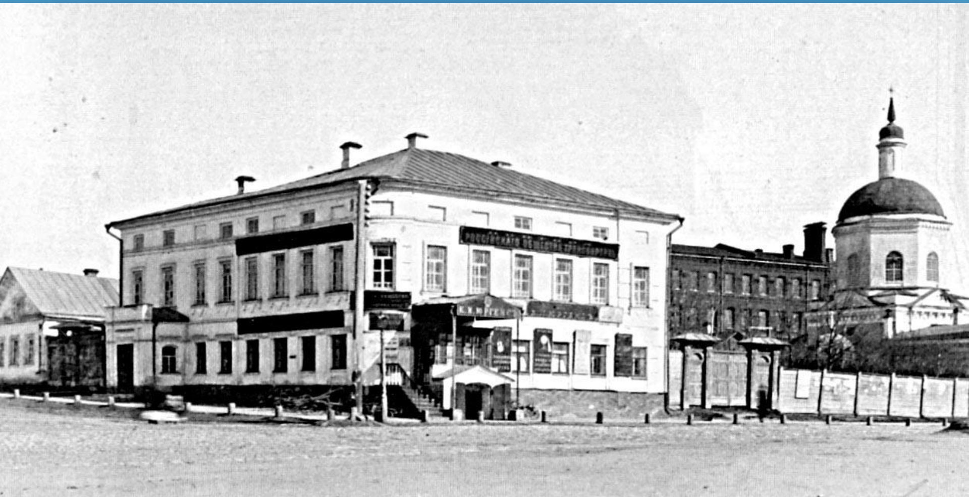
Первоначальный вид дома Гончаровых. Симбирск 1890 г.