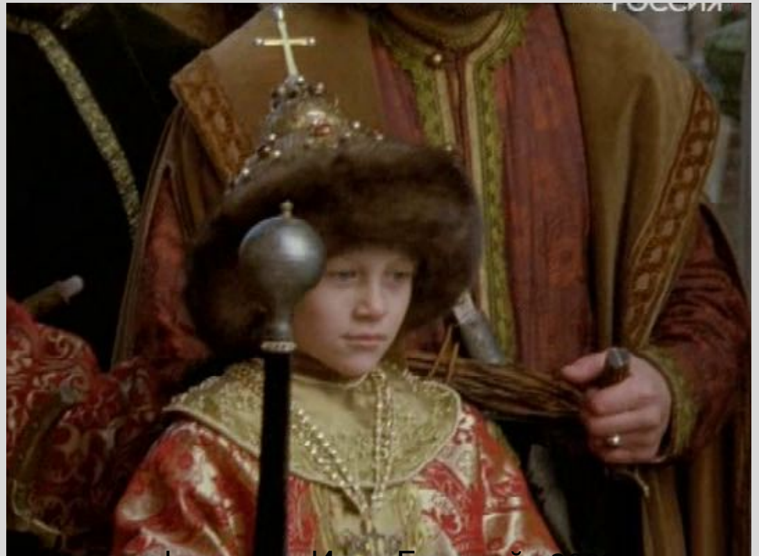
Кадр из фильма «Иван Грозный» 2009г.