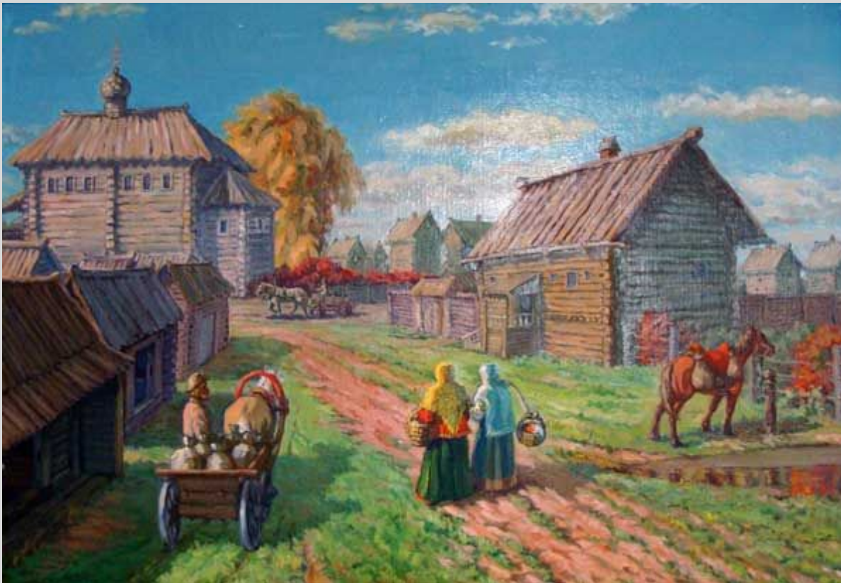
А. Виноградов. Площадь перед земской избой

Земские старосты – избирались черносошными крестьянами и посадскими людьми.