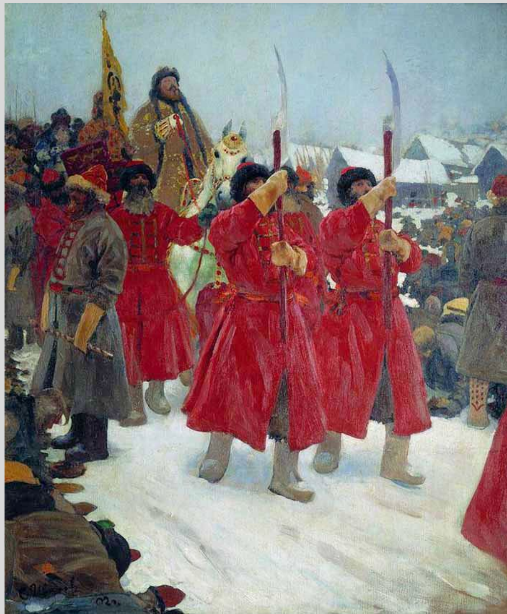
Иванов С.В. «Царь. XVI век» 1902 г.

✓ 1556 г. «Уложение о службе» - определяло точные нормы обязательной службы для всех земледельцев: с каждых 100 четвертей (170 га) земли – 1 конный воин. Во многом уравнивало в правах вотчинников и помещиков.