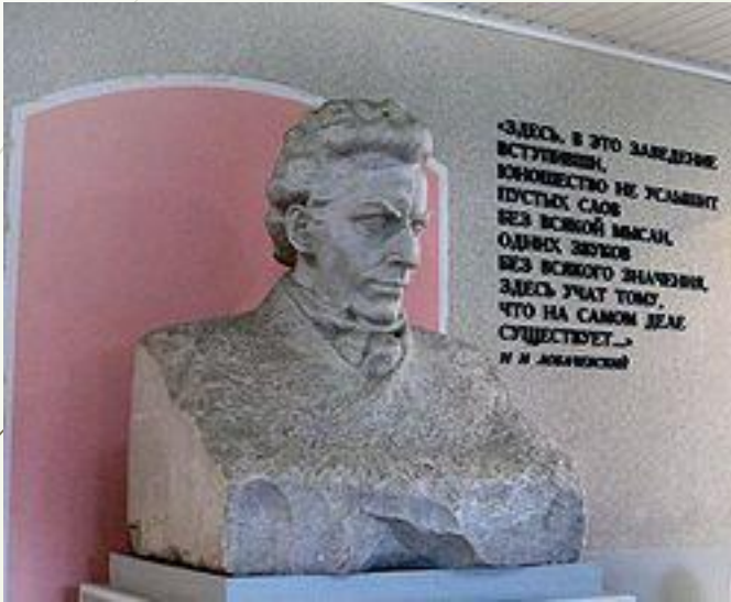
Бюст Н.И.Лобачевского в Нижегородском университете