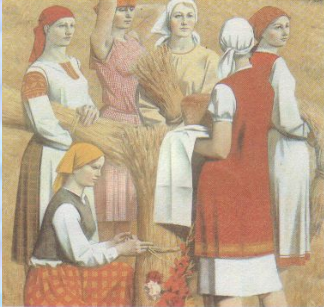
Хлеб земли. Художник А. Синица