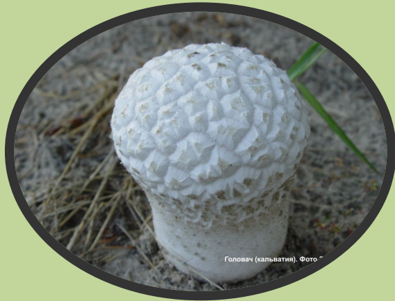
Головач (кальватия). Фото