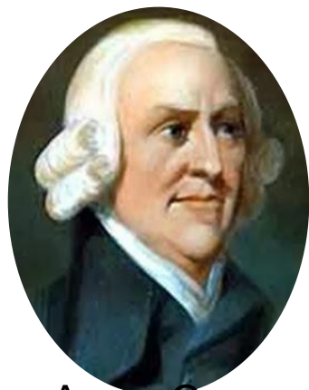
Адам Смит 1723-1790