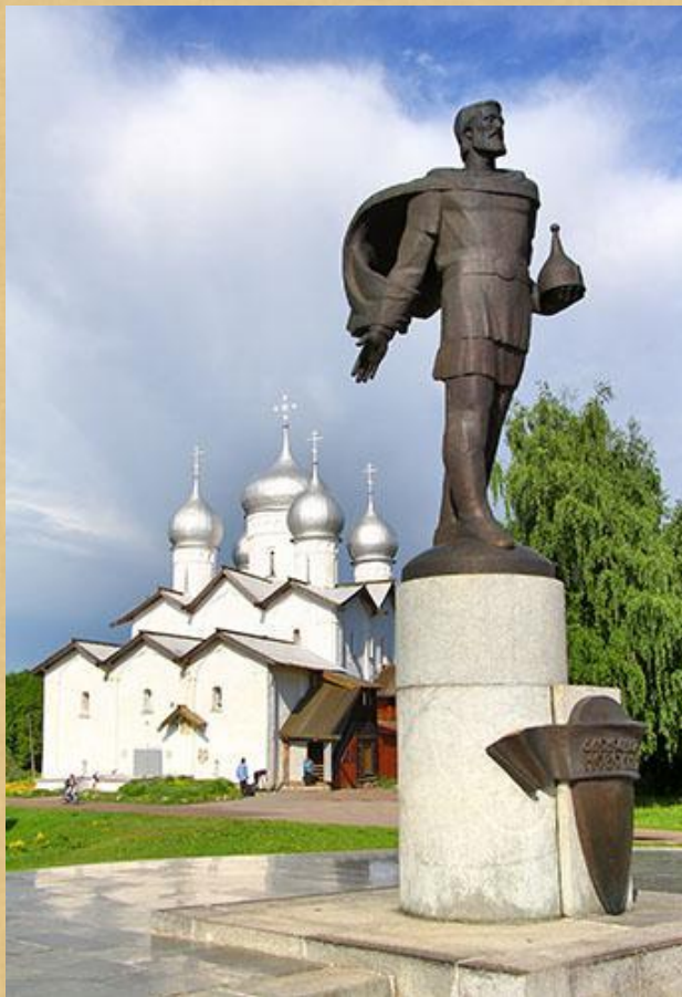
ПАМЯТНИК АЛЕКСАНДРУ НЕВСКОМУ В ВЕЛИКОМ НОВГОРОДЕ, НАПРОТИВ ЦЕРКВИ БОРИСА И ГЛЕБА