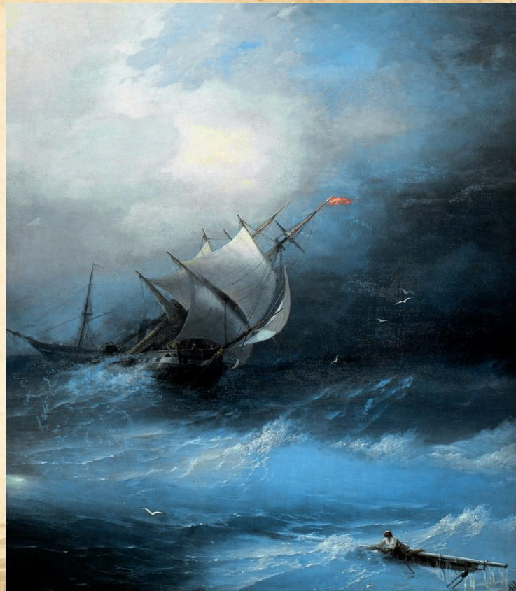
Буря на Ледовитом океане.1864.

Во Франции романтизм в живописи развивался по иным принципам. Бурная общественная жизнь, а также революционные потрясения проявляются в живописи тяготением живописцев к изображению умопомрачительных и исторических сюжетов, также, с «нервным» возбуждением и патетикой, которые достигались ослепительным цветовым контрастом, некоторой хаотичностью, экспрессией движений, а также стихийностью композиций.