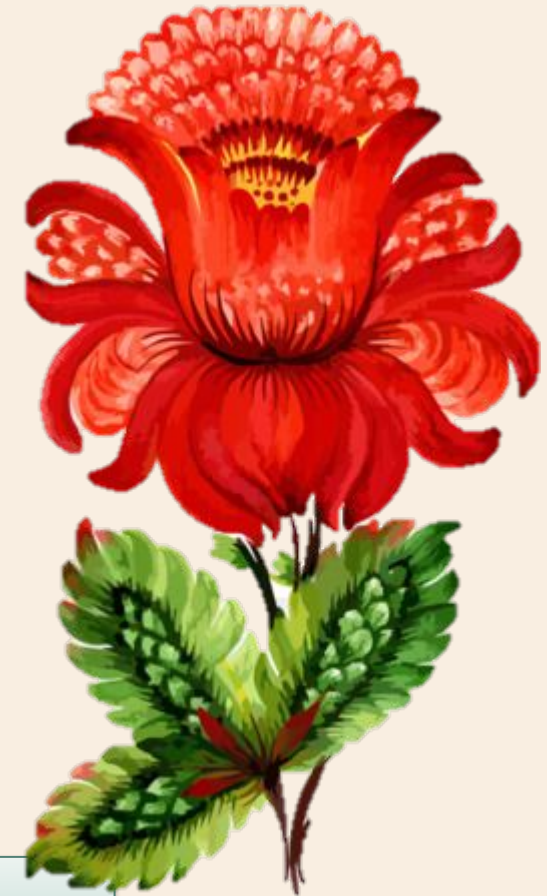
Сергей Тимофеевич Аксаков