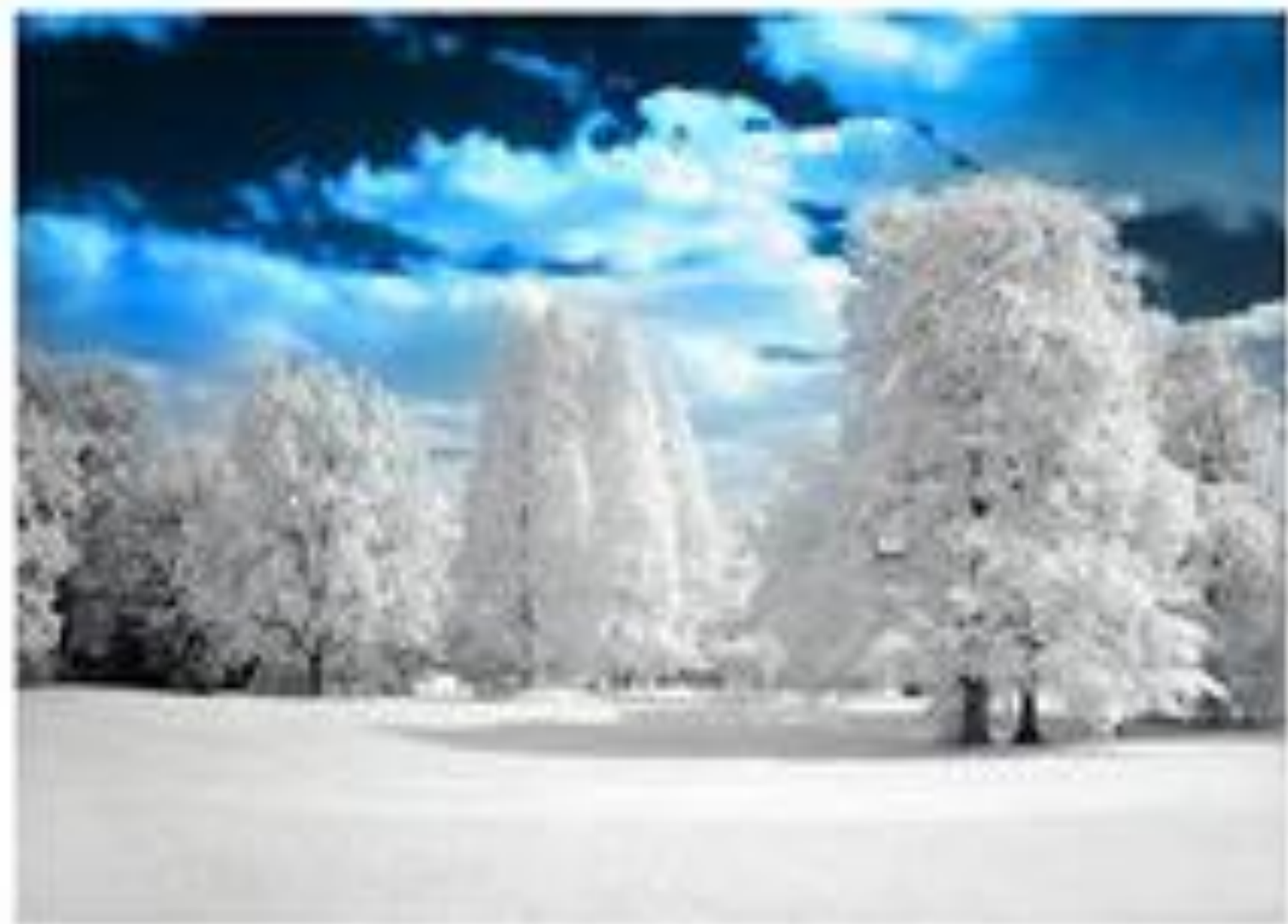
Black and white photograph of a snowy landscape with trees.