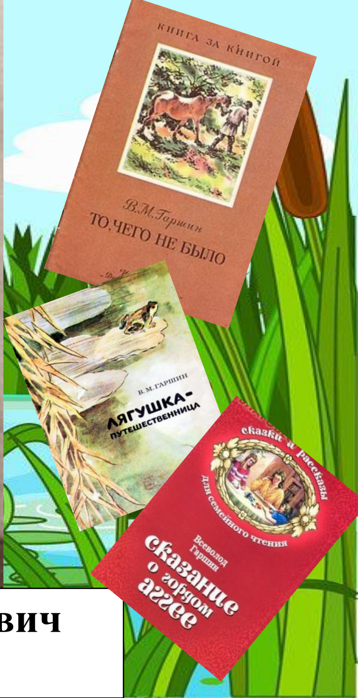
Гаршин Всеволод Михайлович (1855-1888)