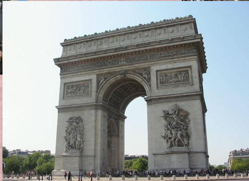
Arc de triomphe