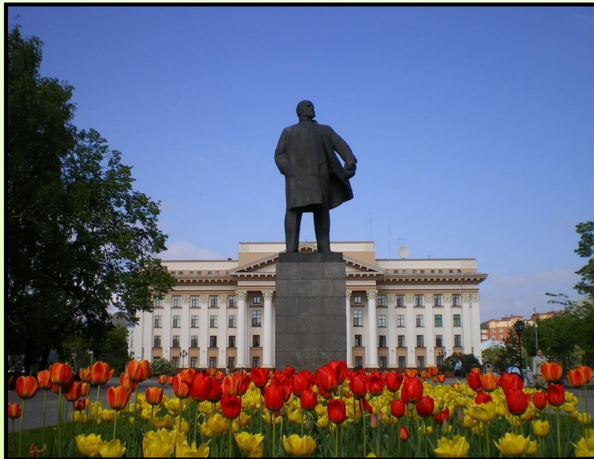
Памятник Ленину в Тюмени