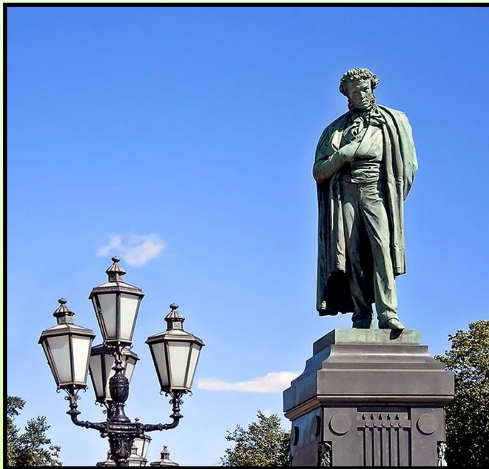
Памятник Пушкину в Москве