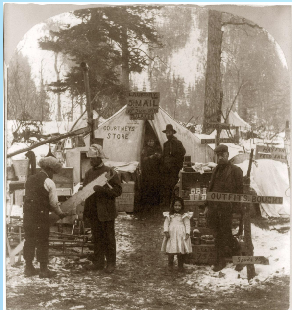
9212—Courtney's Store and Post Office, Sheep Camp, Alaska.