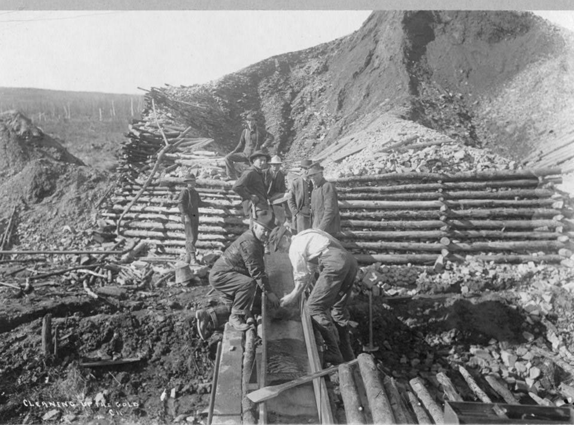
CLEANING UP THE GOLD C. 11