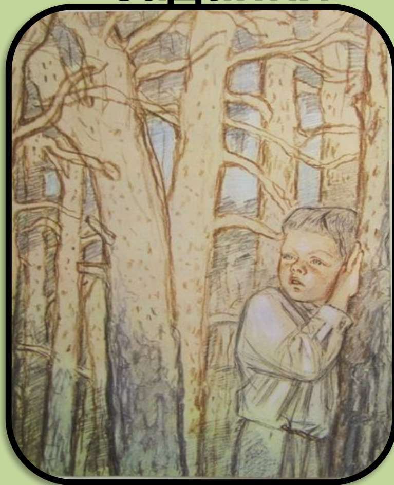
Иван Бунин «Детство»