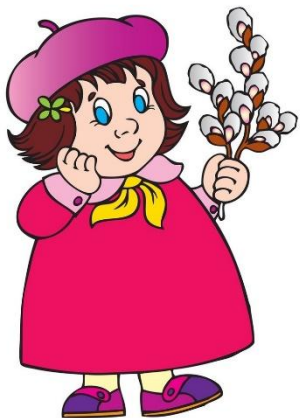
Иллюстрация по желанию