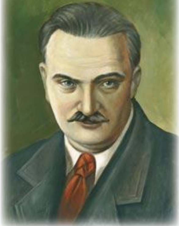
Бианки Виталий Валентинович (11.02.1894-10.06.1959)

Книги известного детского писателя Виталия Валентиновича Бианки остались в памяти нескольких поколений детей, ставших в свою очередь родителями, а затем бабушками и дедушками.