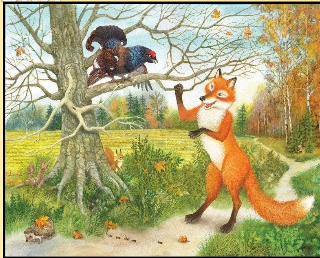
Лиса и тетерев