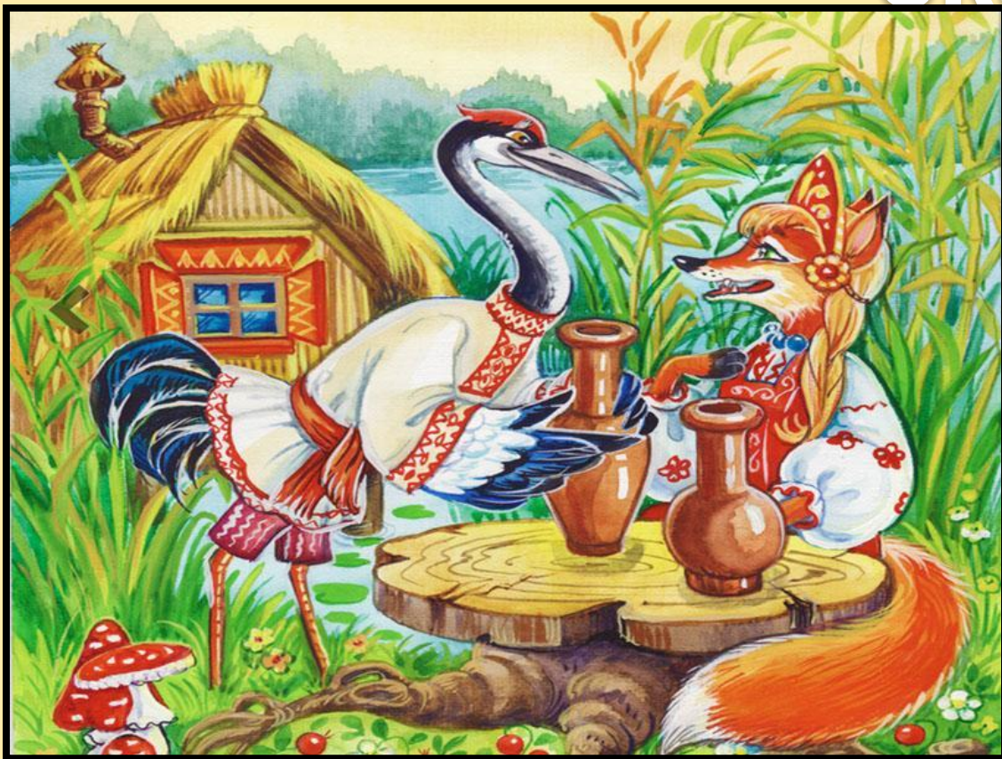
Лиса и журавль