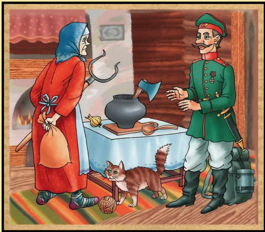
Каша из топора