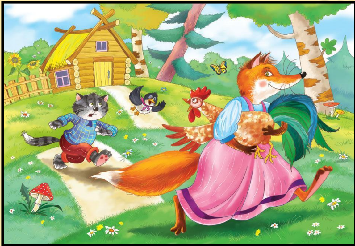
Кот, петух и лиса