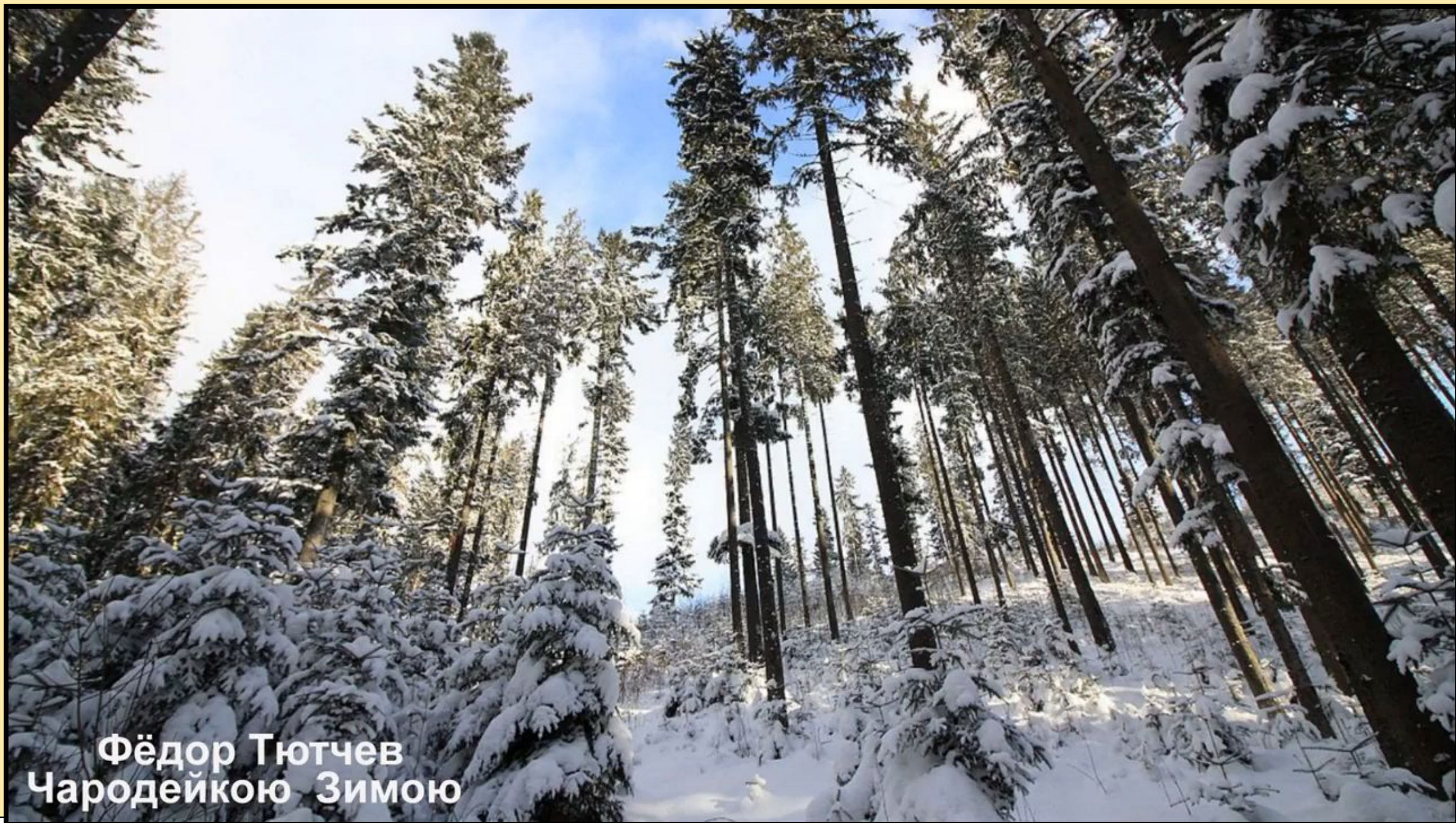
Фёдор Тютчев Чародейкою Зимой