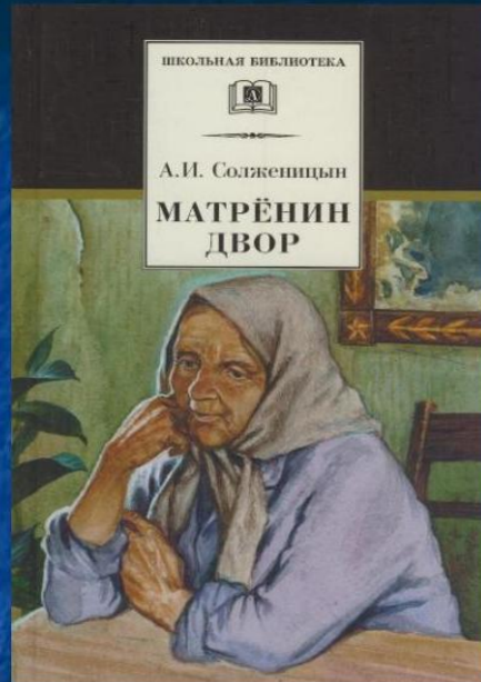
Иллюстрация художника В. Бритвина