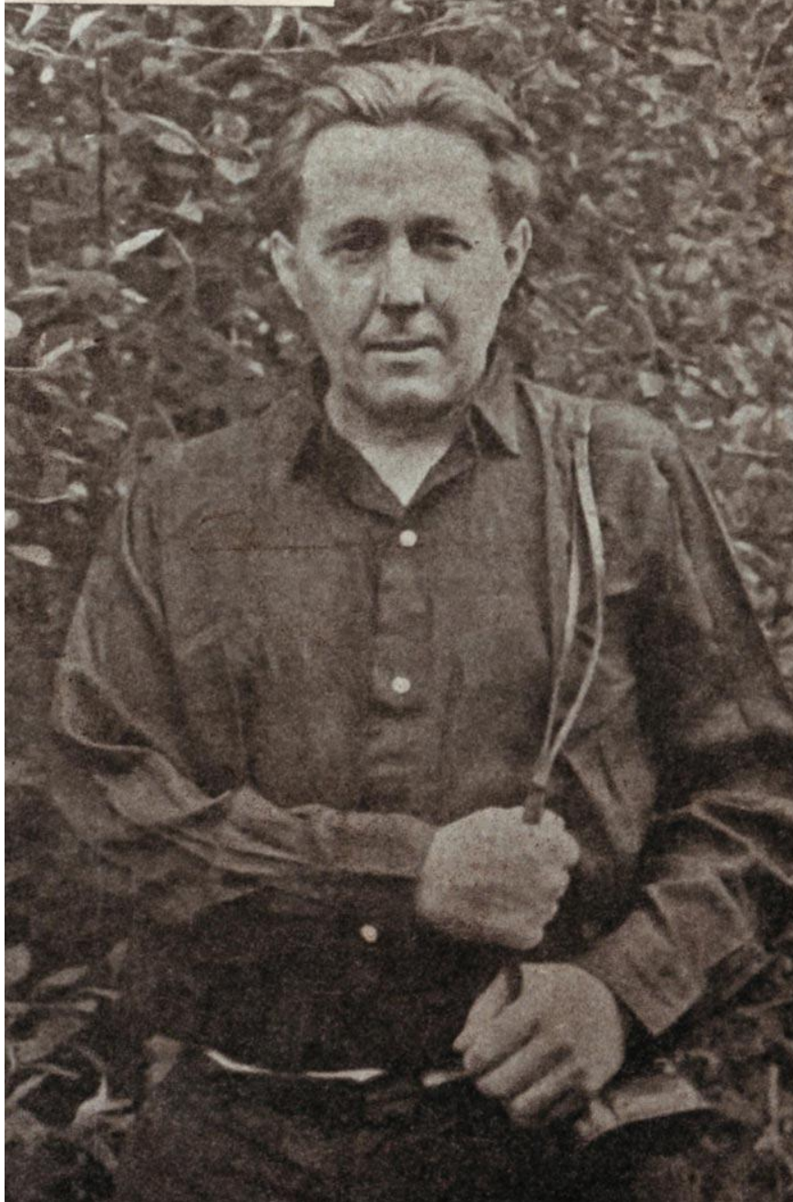
Александр Солженицын в Рязани, ок. 1958-1960 гг.