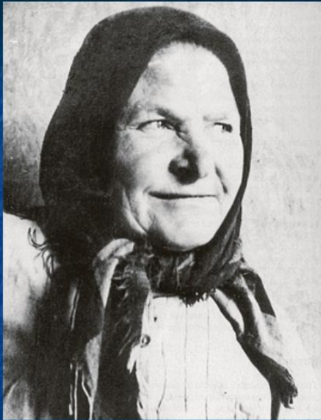
Фото Матрёны