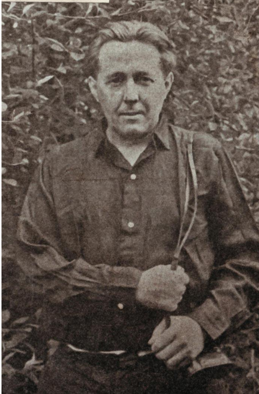
Александр Солженицын в Рязани, ок. 1958-1960 гг.