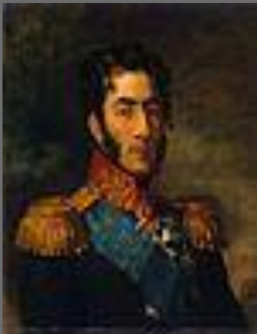
Пётр Иванович Багратион