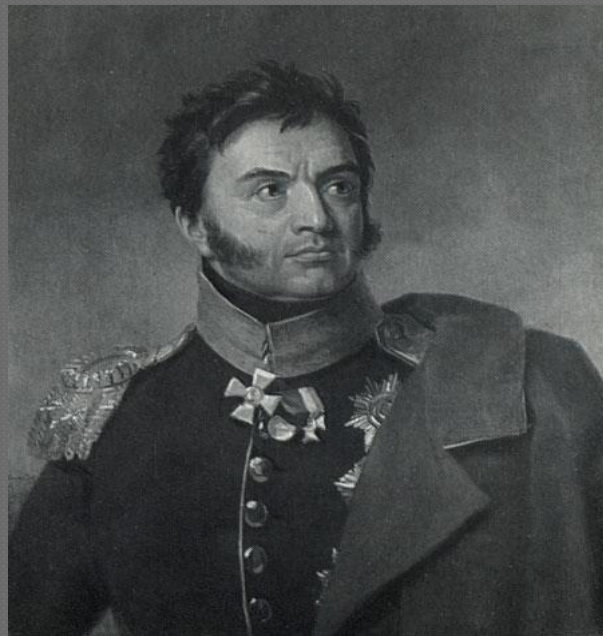
Николай Николаевич Раевский