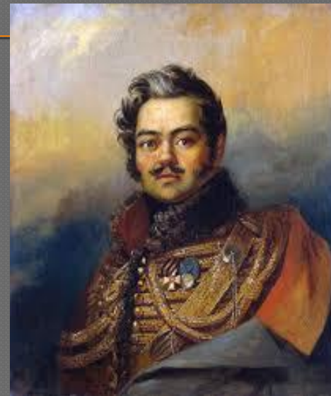
Денис Васильевич Давыдов