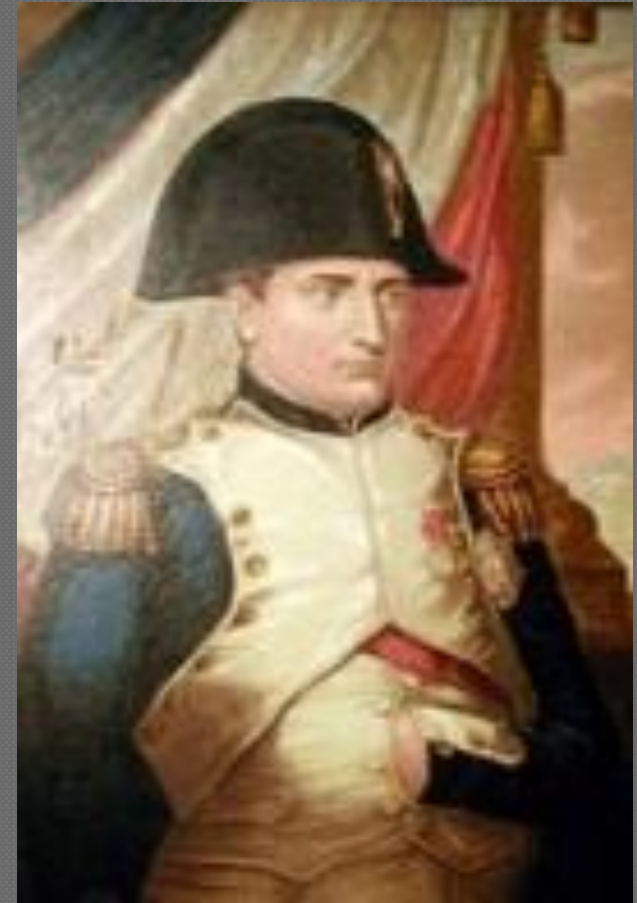
Человек, у которого «помрачены ум и совесть»