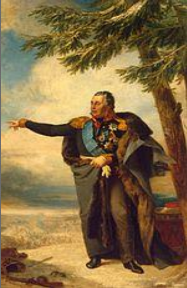
«Народный полководец», «спаситель отечества».