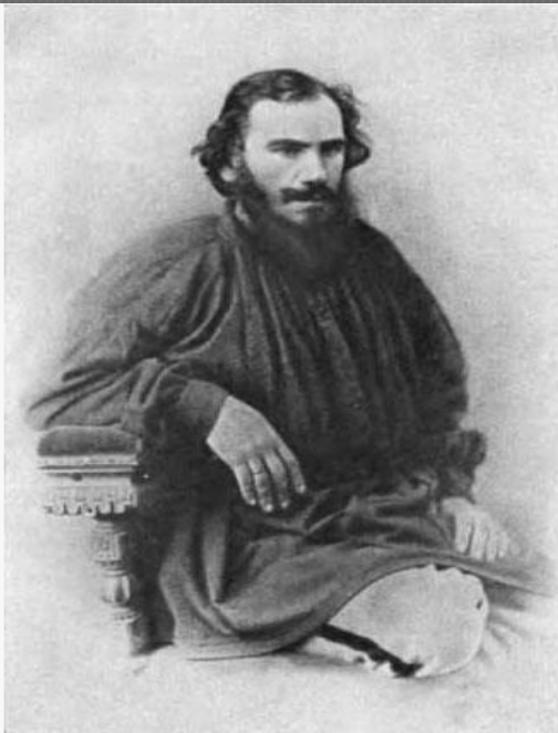
Лев Николаевич Толстой. Фото. 1868 г.