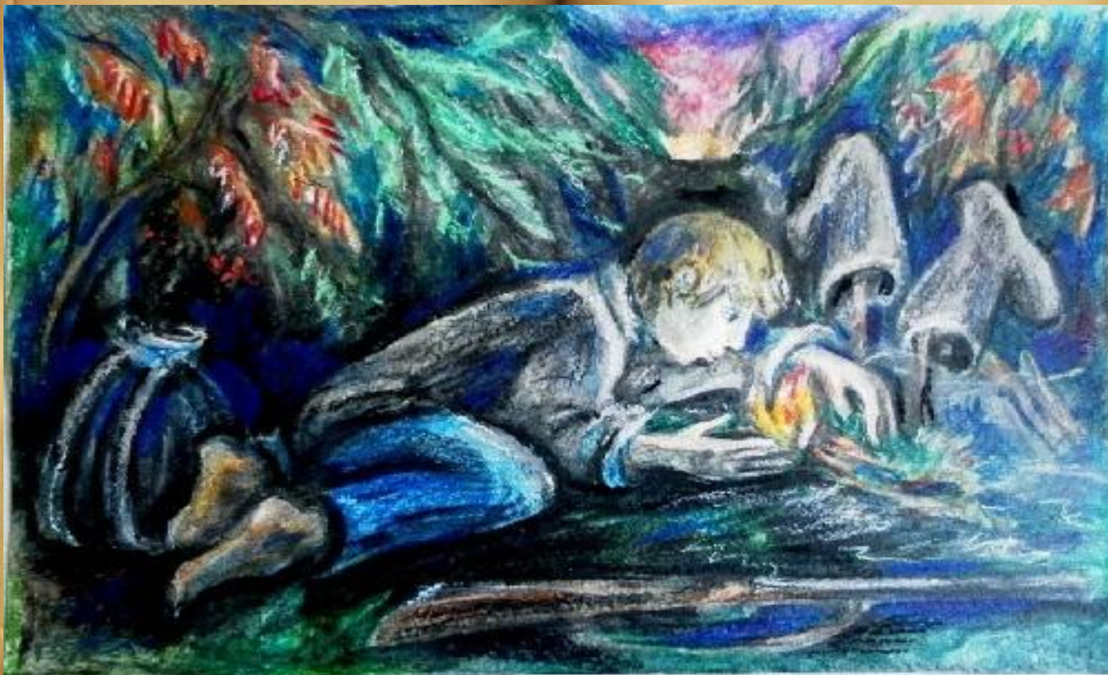
ВАСЮТКИНО ОЗЕРЦО - последняя сценка

Слушаем 2 группу. Прокомментируйте этот эпизод.