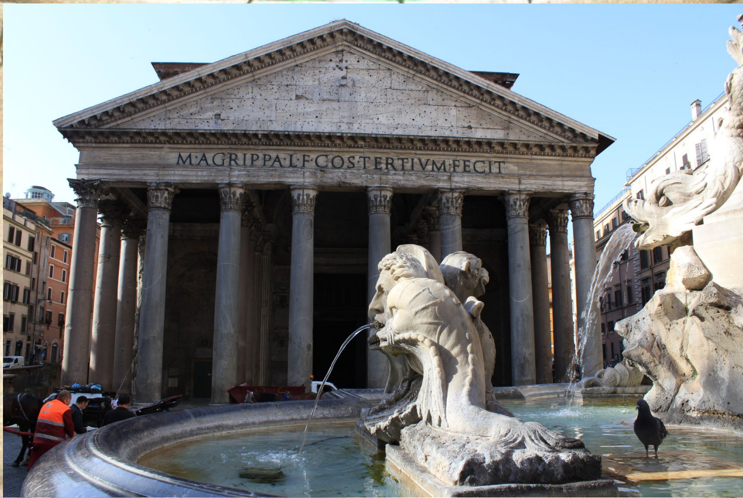
Пантеон- храм всех богов