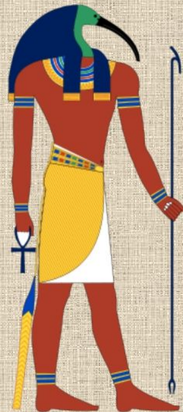
Тот – мудрости