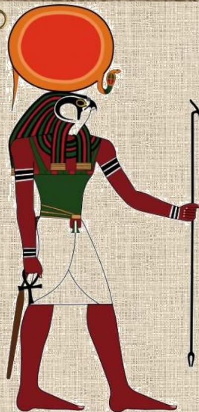
Ра – бог солнца