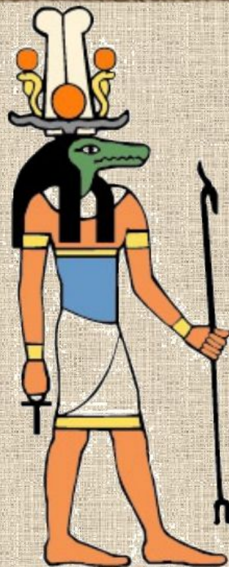
Себек – бог воды