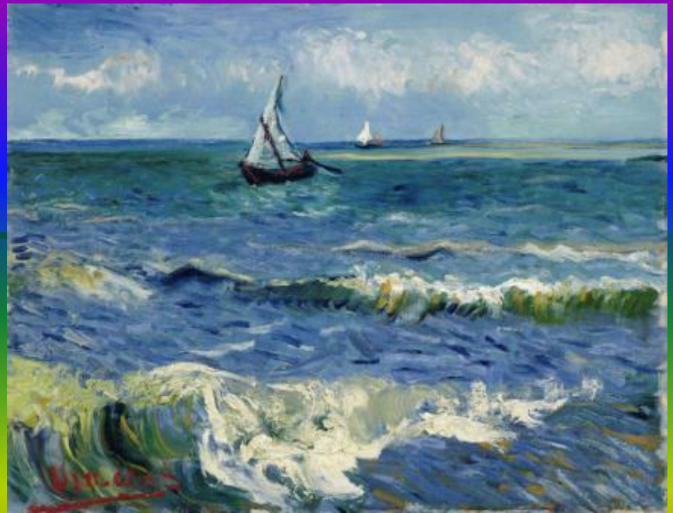
В. Ван Гог «Море в Сен-Мари»

Задание: Подобрать термины, характеризующие эти картины, характер музыки для этих картин?