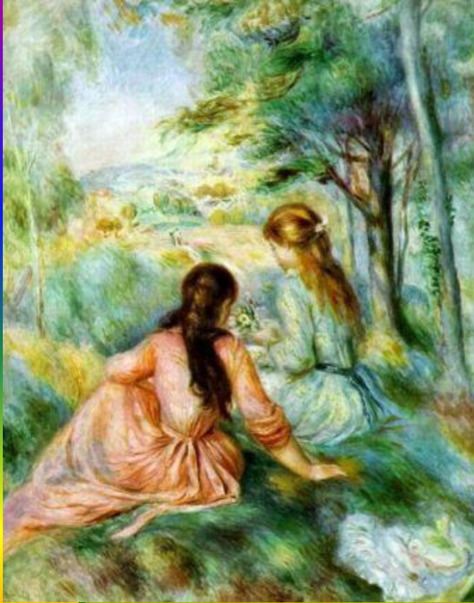
О. Ренуар «На лугу»