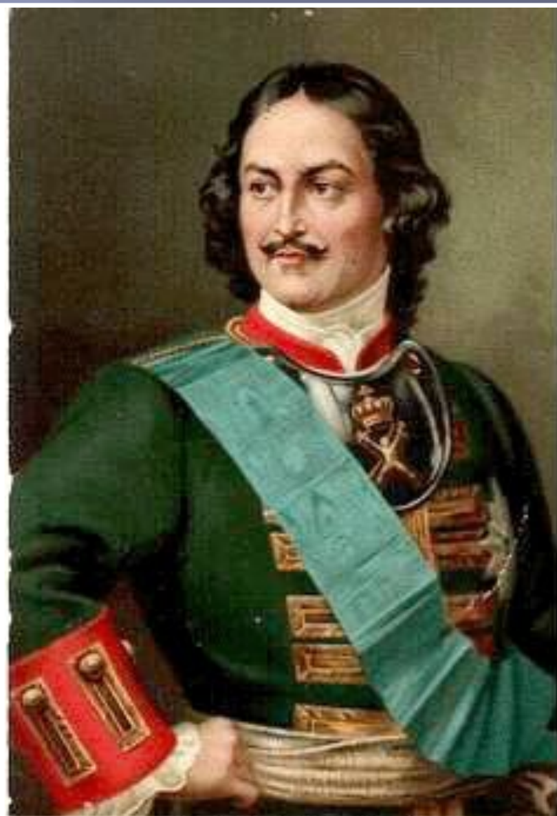
ИМПЕРАТОРЪ ПЕТРЪ ВЕЛИКІИ ПОВѢДИТЕЛЬ при ПОЛТАВѢ 27 Іюня 1709 г. myJulia.Ru