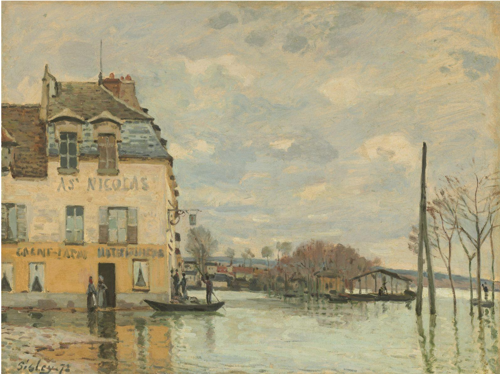
Художник Альфред Сислей, 1872. Наводнения в Порт-Марли , небольшой деревне на берегу Сены.