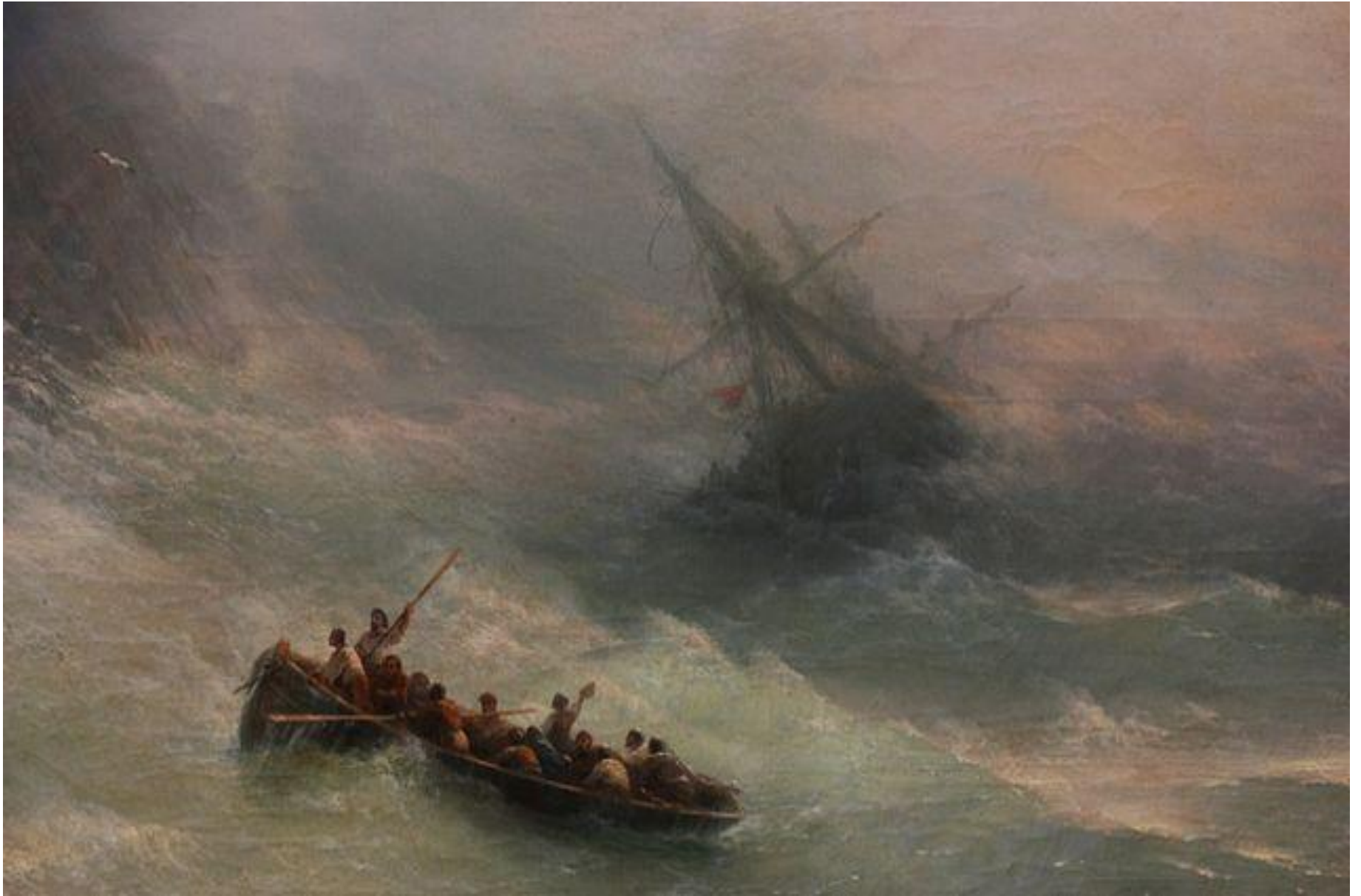
Художник Айвазовский. «Радуга», 1873 г.