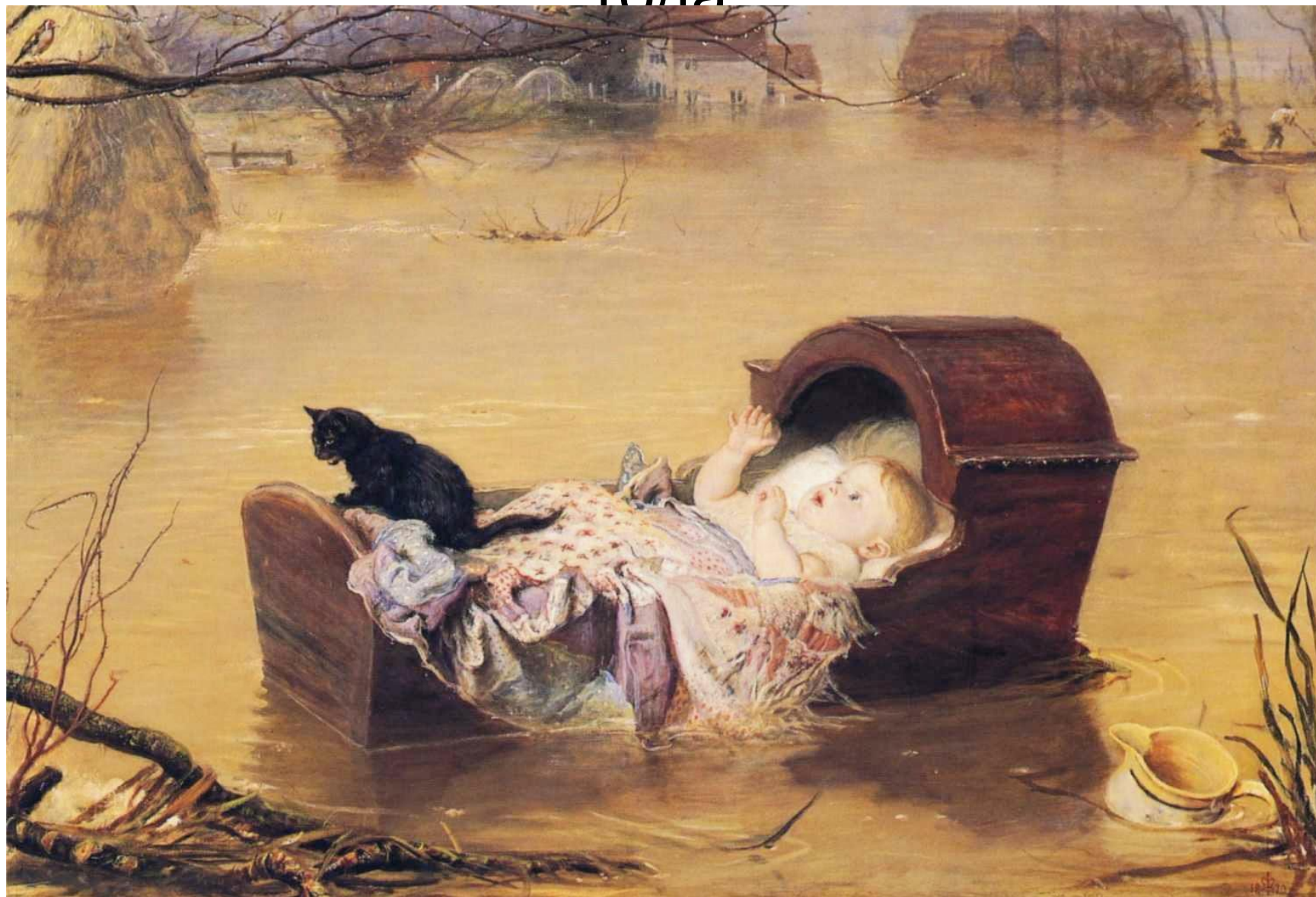
Художник Джон Эверетт Миллес . 1870 г. Шеффилдское наводнение, в марте 1864 г. в Великобритании.