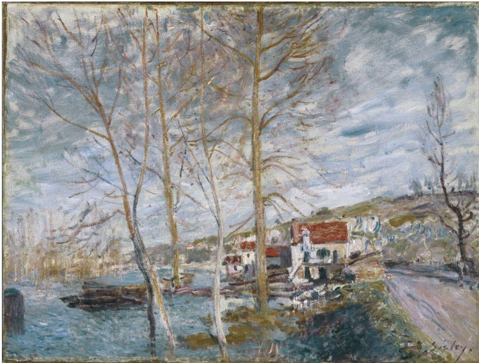
Художник Альфред Сислей. Наводнение в Морэ , 1879 г.