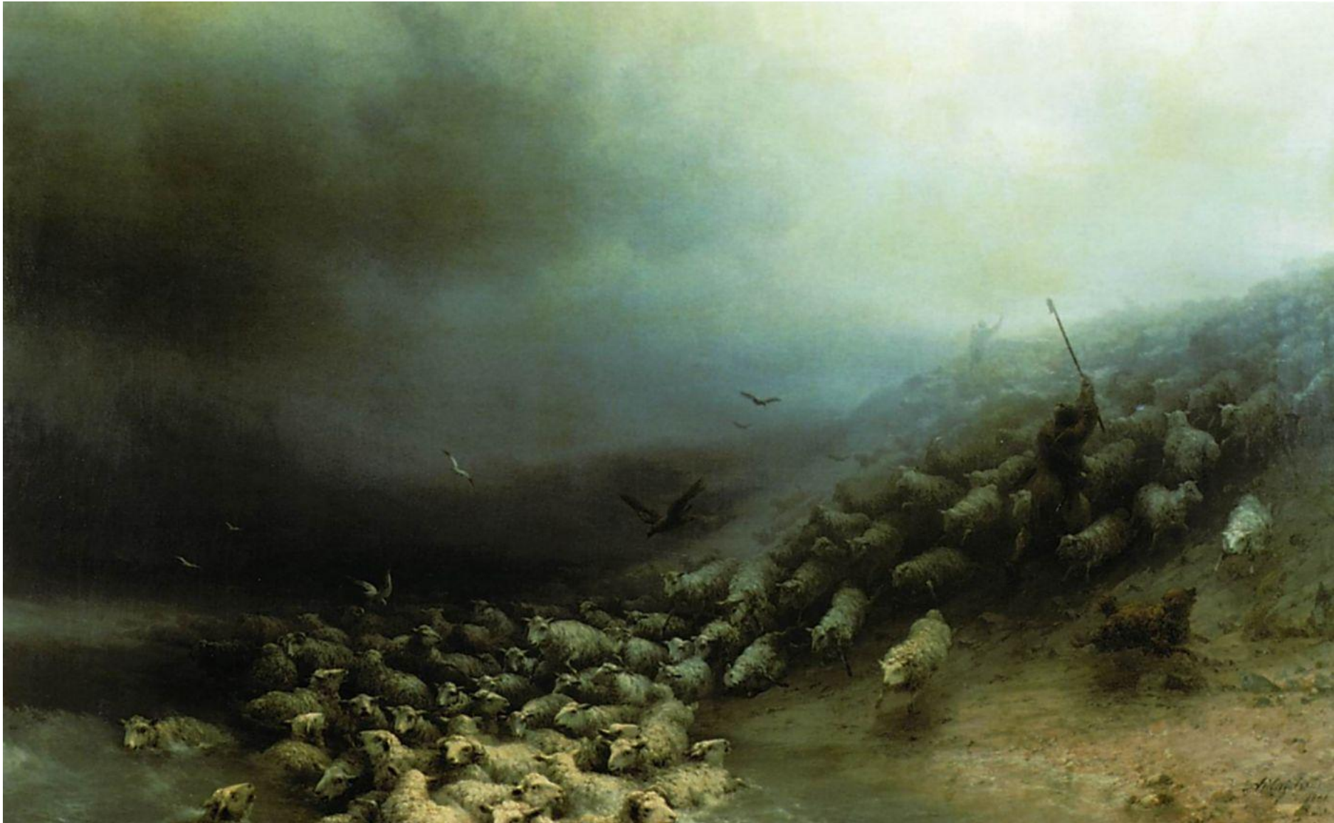
Художник Иван Константинович Айвазовский, « Отара овец в бурю » 1861 г.