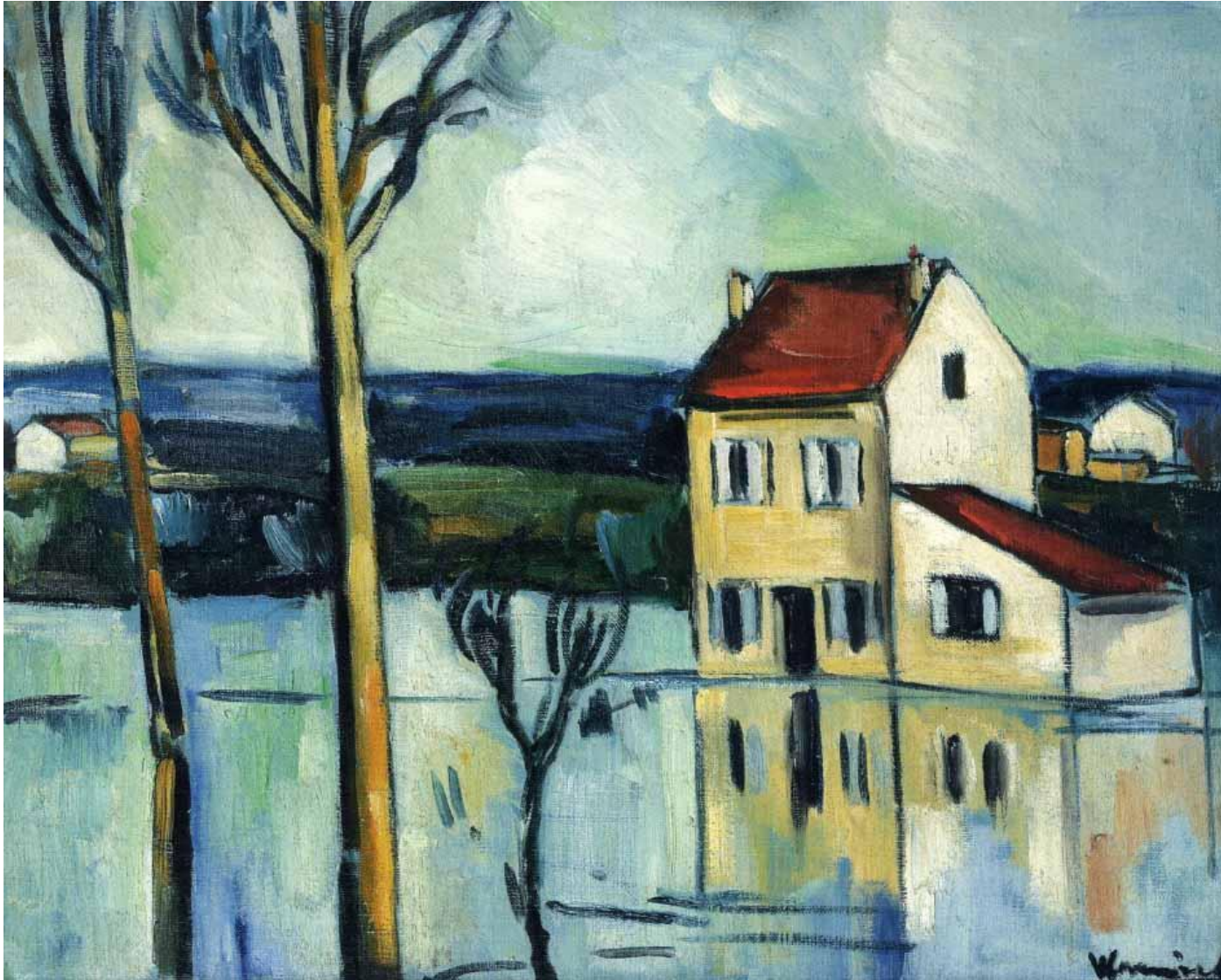
Французский художник Морис де Вламинк . Дом на берегу реки. 1909 г.