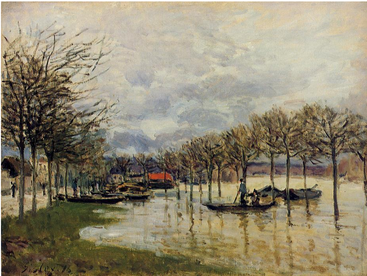
Французский художник Альфред Сислей, 1876 г. Наводнение на пути в Сен-Жермен.