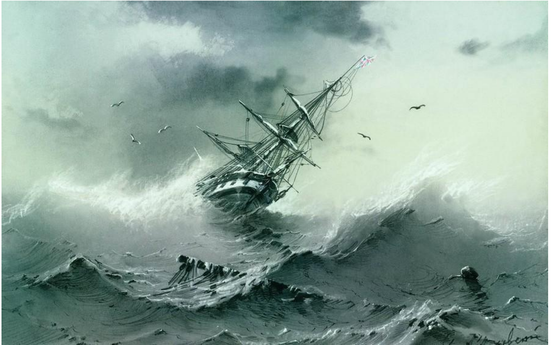
Тонущий корабль , Айвазовский, 1854 г. Карандашный рисунок.