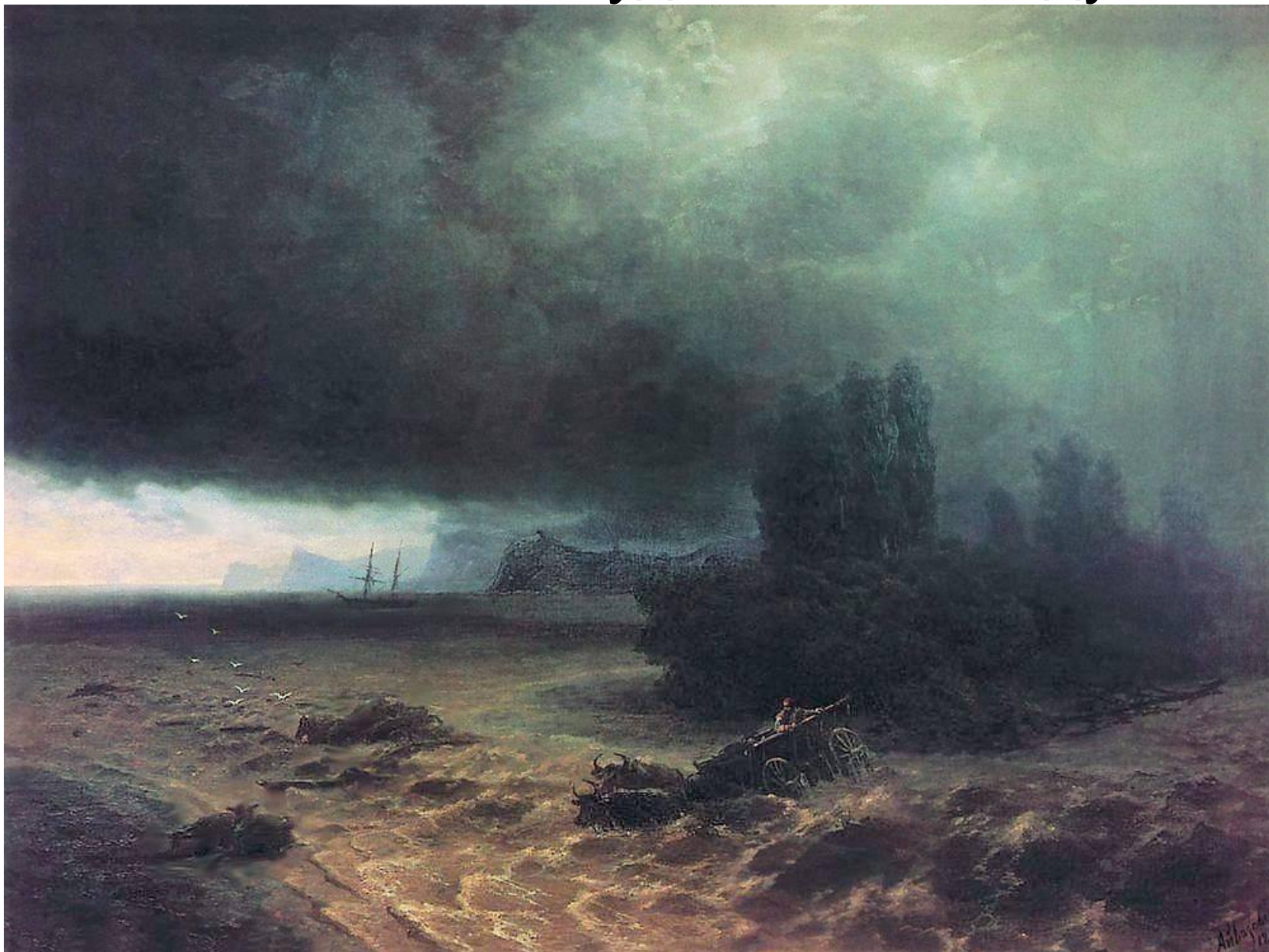
Художник И. К. Айвазовский - Ливень в Судаче . 1897 г. Феодосийская картинная галерея им. И.К. Айвазовского.