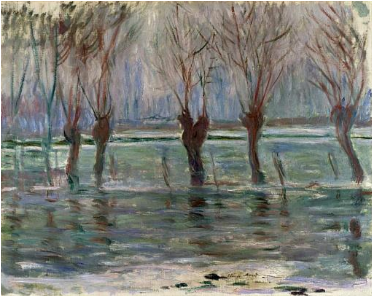
Клод Моне «Наводнение в Живерни», 1896 г. Живерни — коммуна во Франции в департаменте Эр в регионе Нормандия.