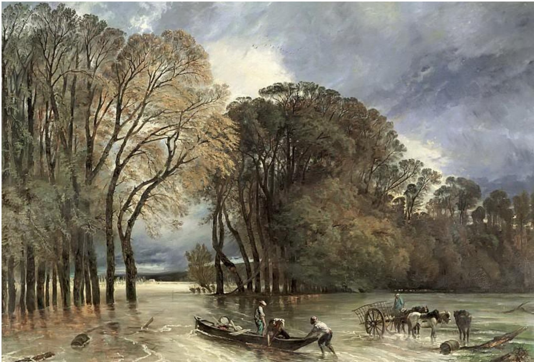
Юэ, Поль, 1855 г. -- Наводнение в Сен-Клу , Лувр.