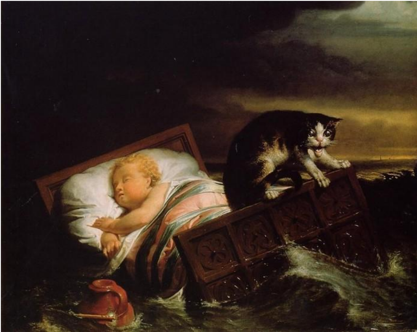
Картина британского художника голландского происхождения Лоуренса Альма-Тадема .