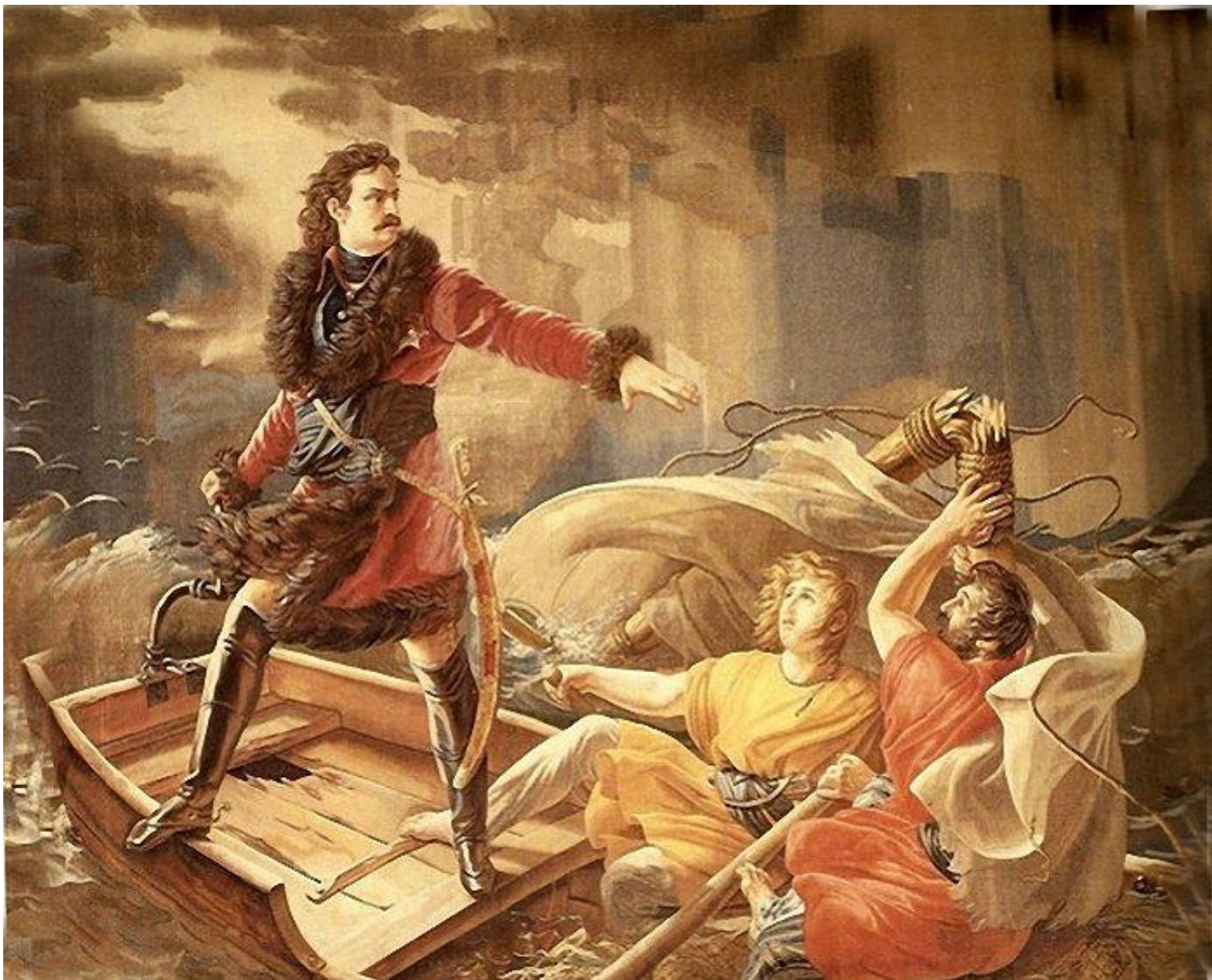
Художник Карл Штейбен, «Петр I во время бури на Ладожском озере спасает утопающих», 1812 г.