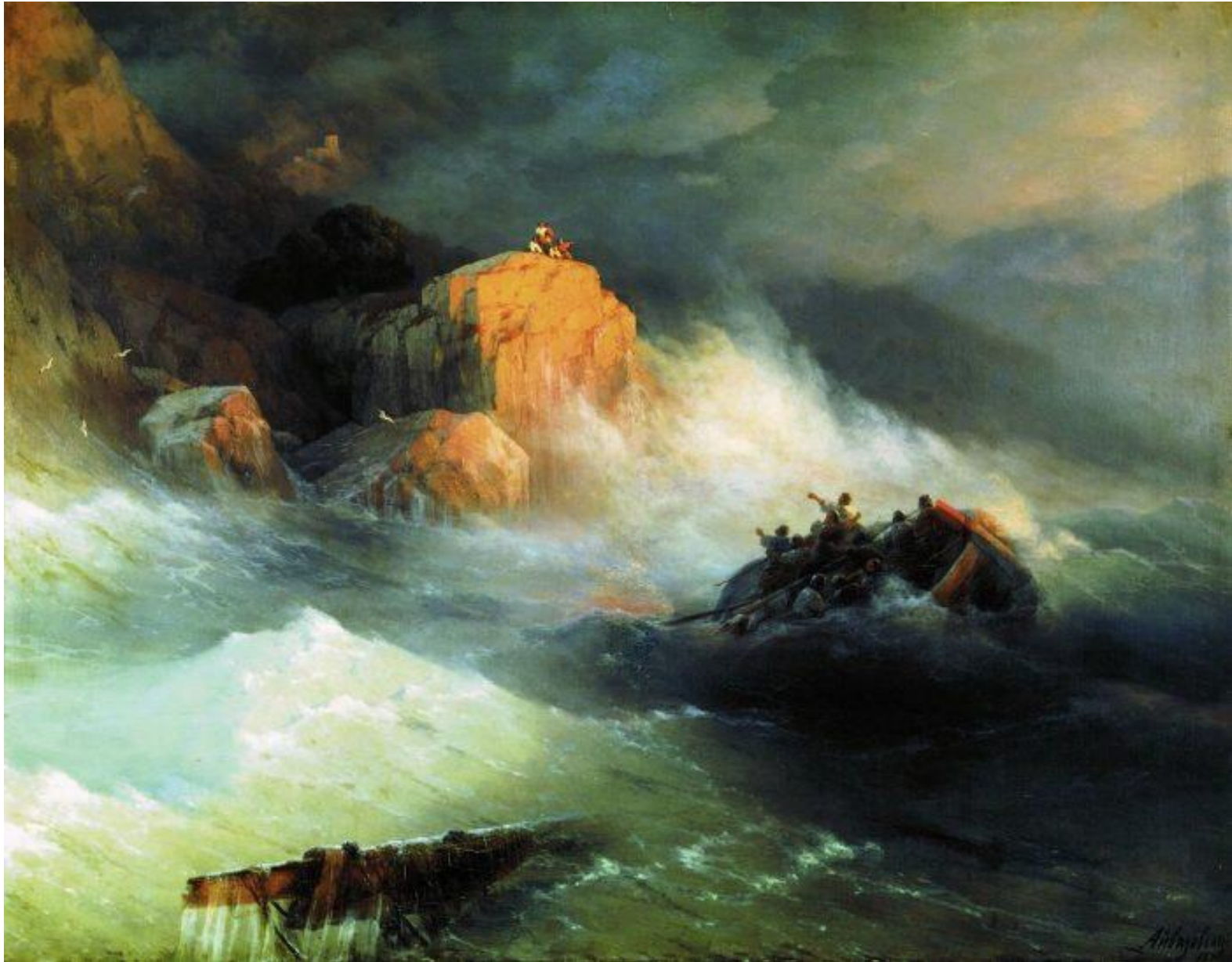
Художник Айвазовский. «Кораблекрушение».