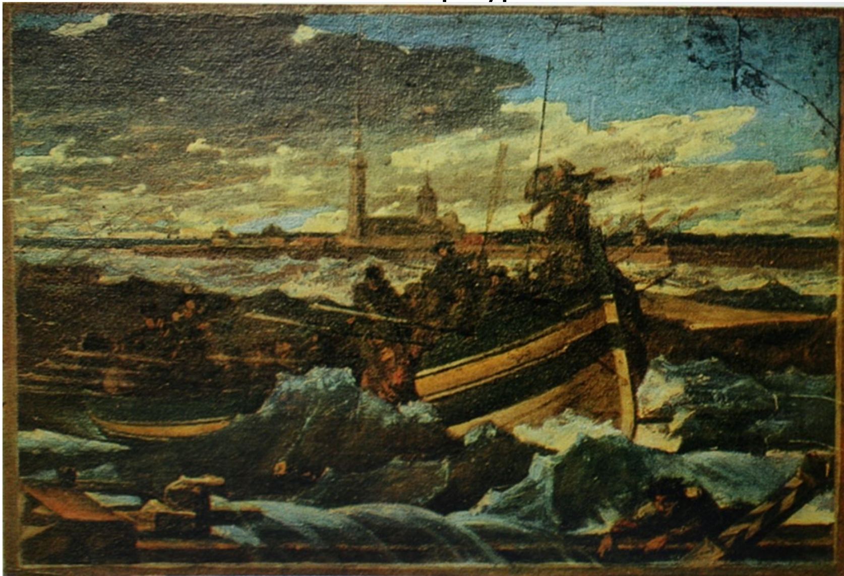
Художник В. К. Шебуев . Граф Бенкендорф, спасающий в наводнение 1824 года погибающих на Неве.