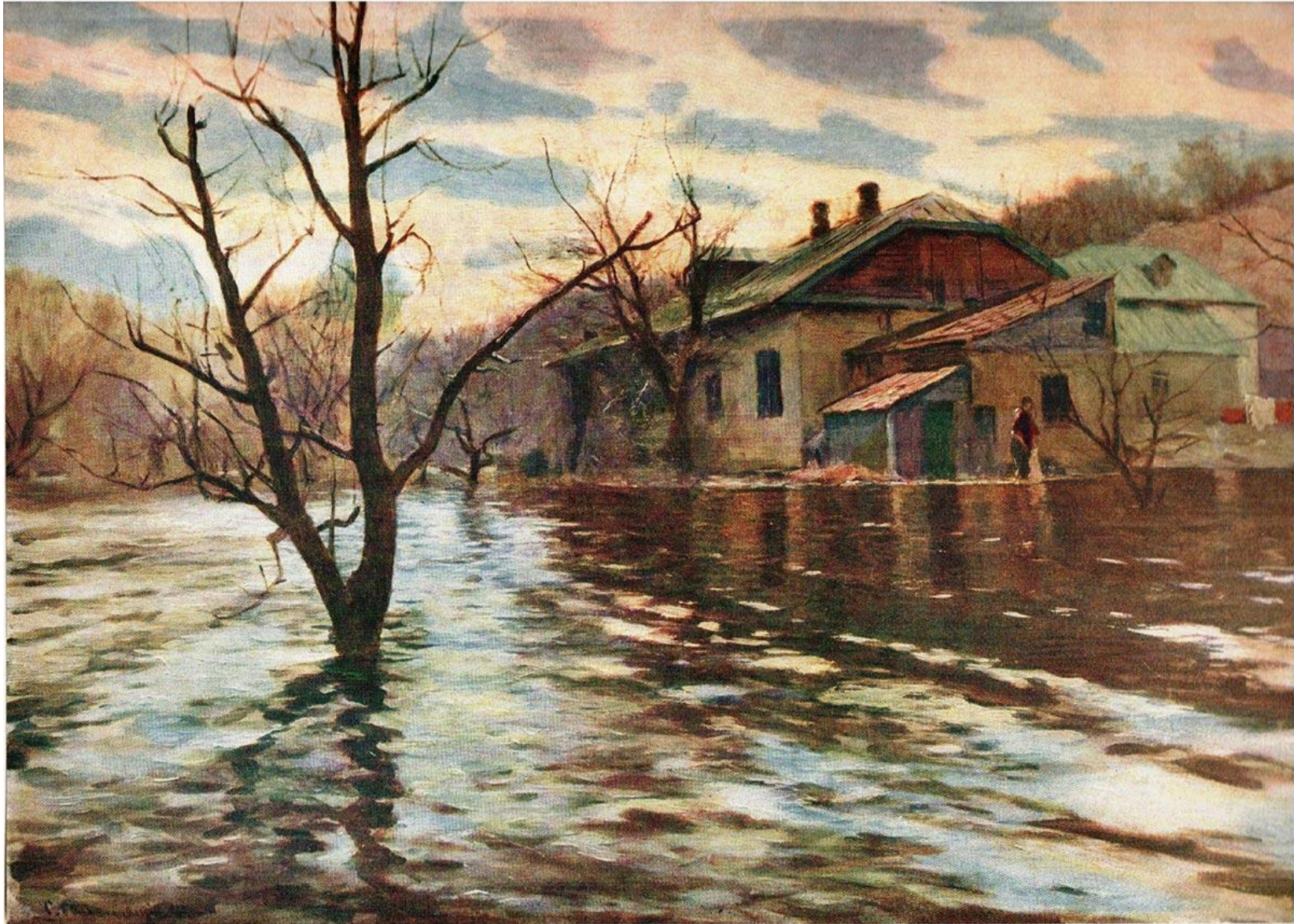
Художник Светославский Сергей Иванович , 1900-1903 г. Национальный художественный музей Украины, Киев.