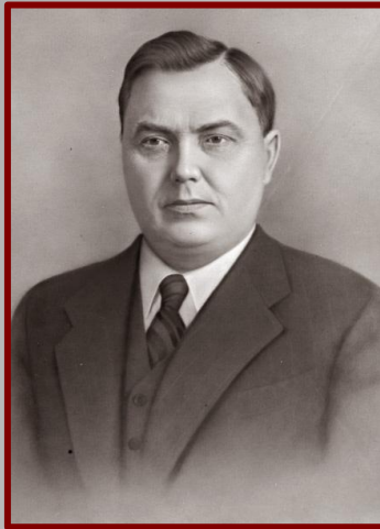
Г.М. Маленков Председатель Совета Министров СССР