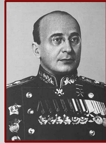
Л.П. Берия глава Министерства Внутренних Дел