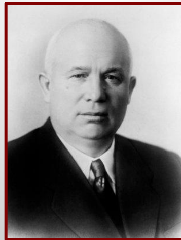
Н.С. Хрущев Секретарь ЦК КПСС