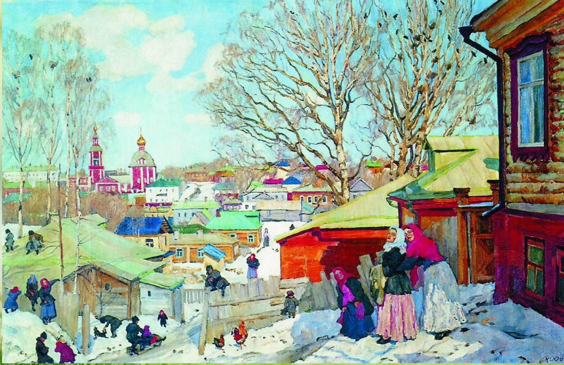
«Весенний солнечный день»