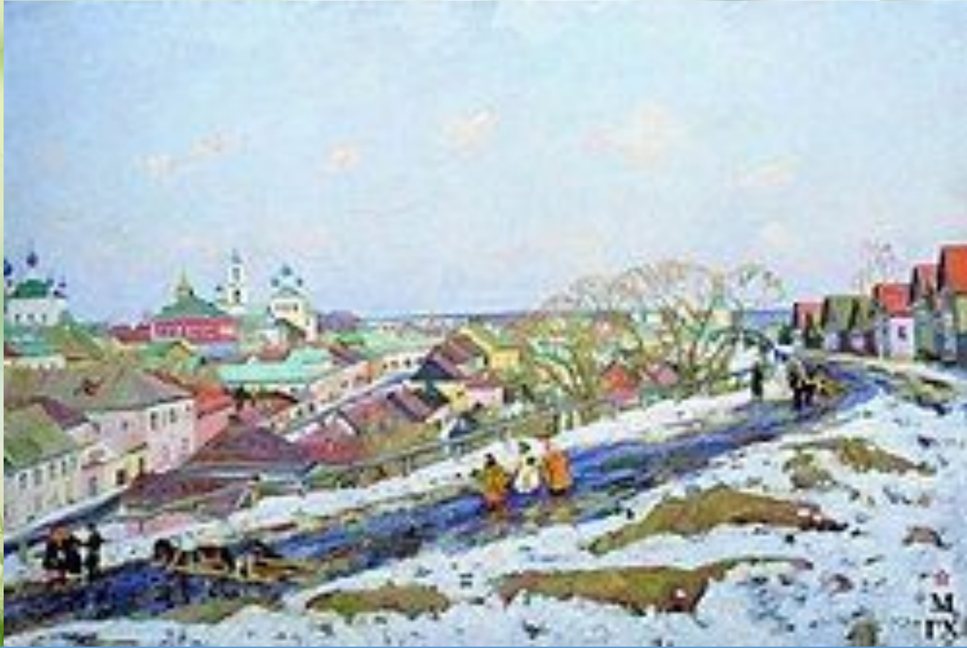
«В провинции. Город Торжок»