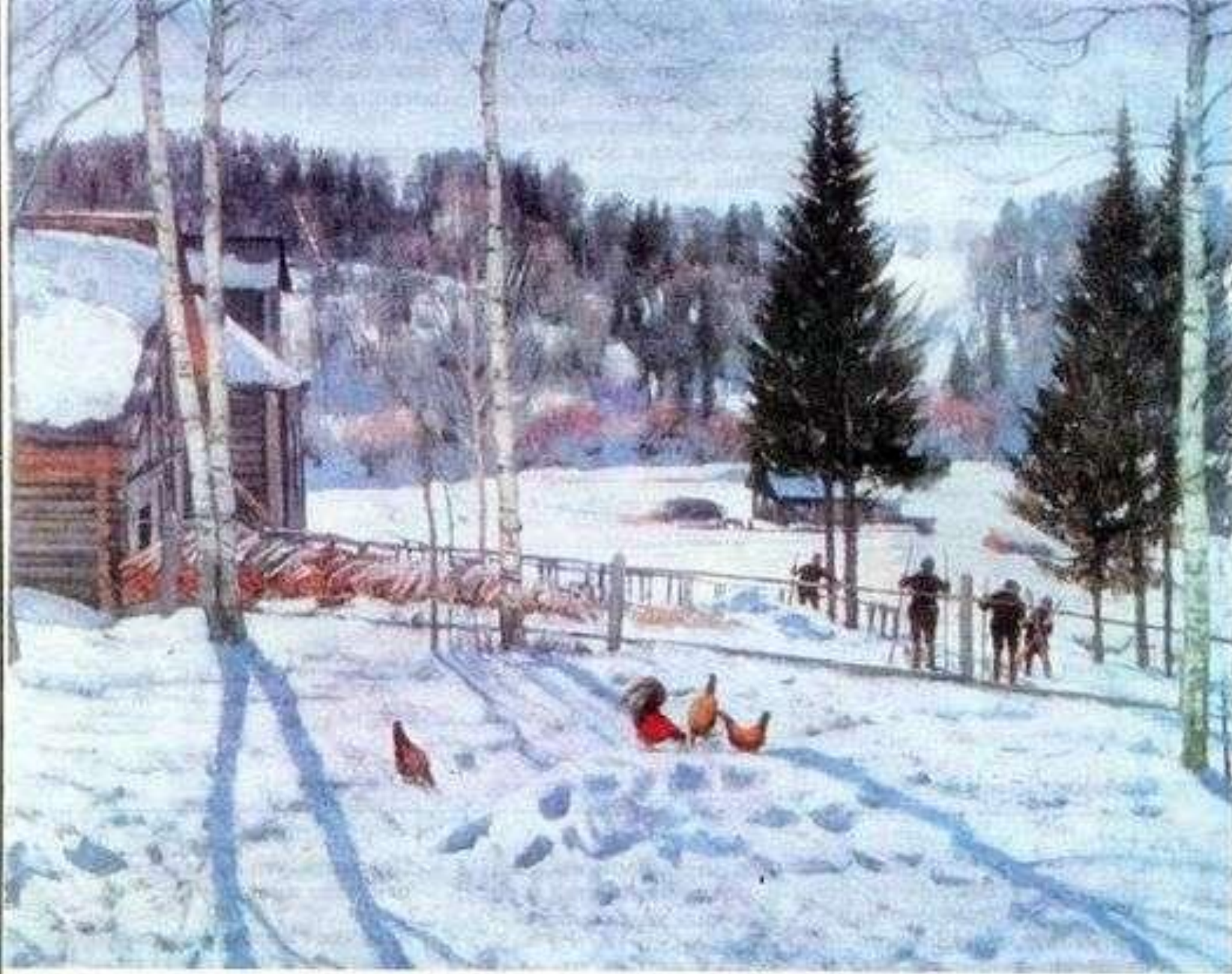
«Конец зимы. Полдень»