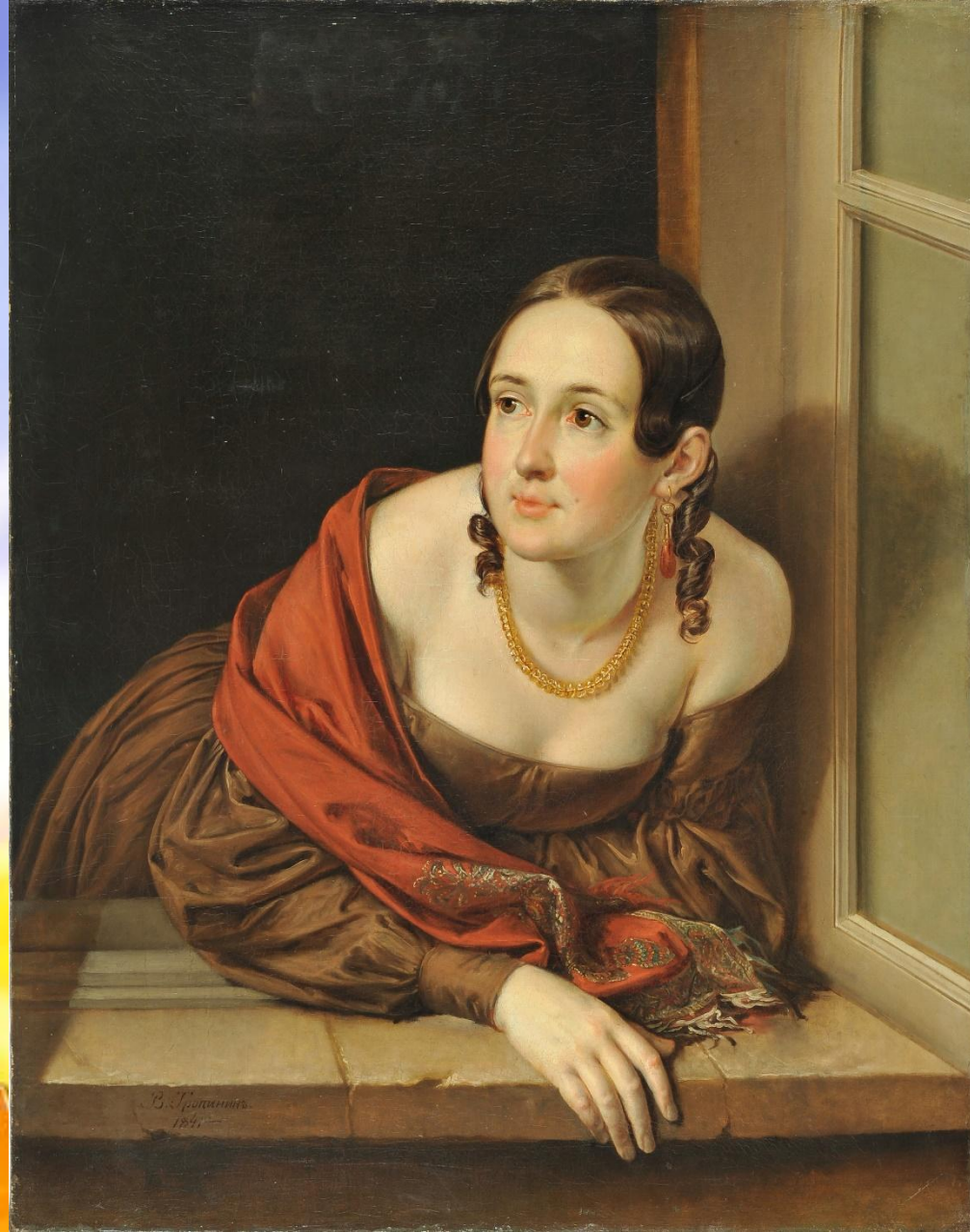
«Женщина в окне»