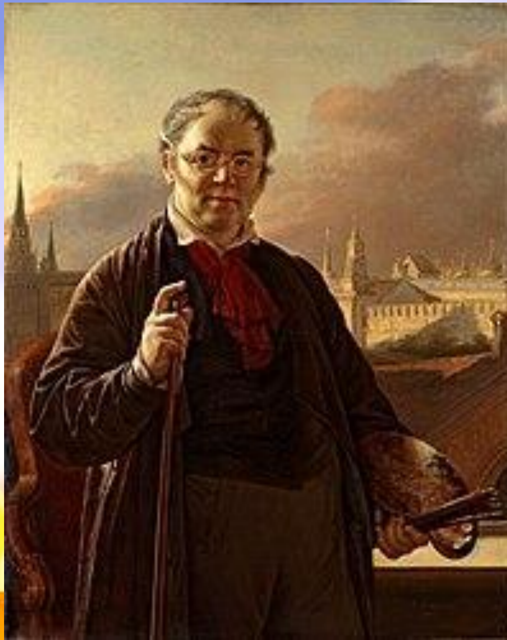
Василий Андреевич Тропинин