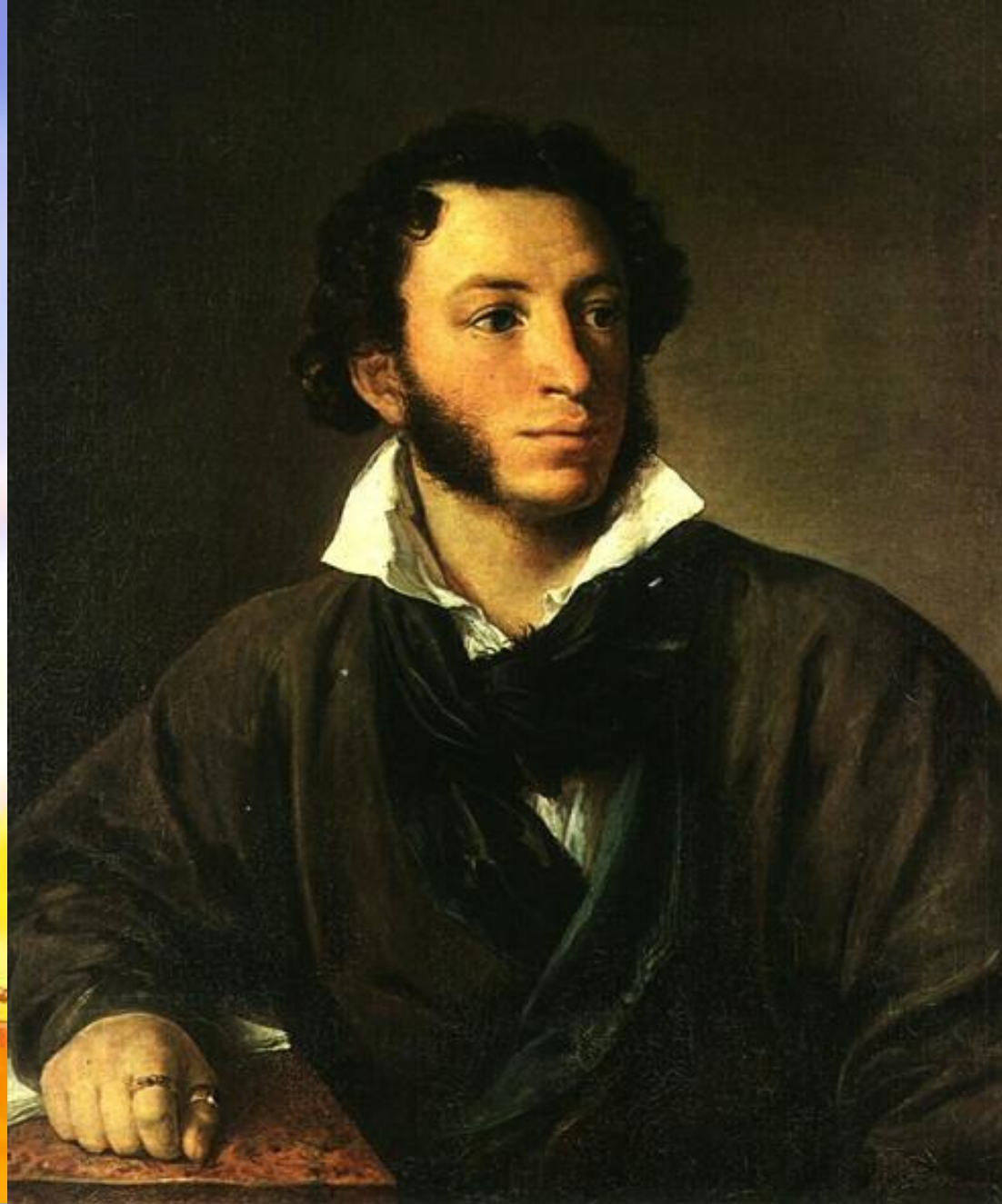
«Портрет А.С. Пушкина»