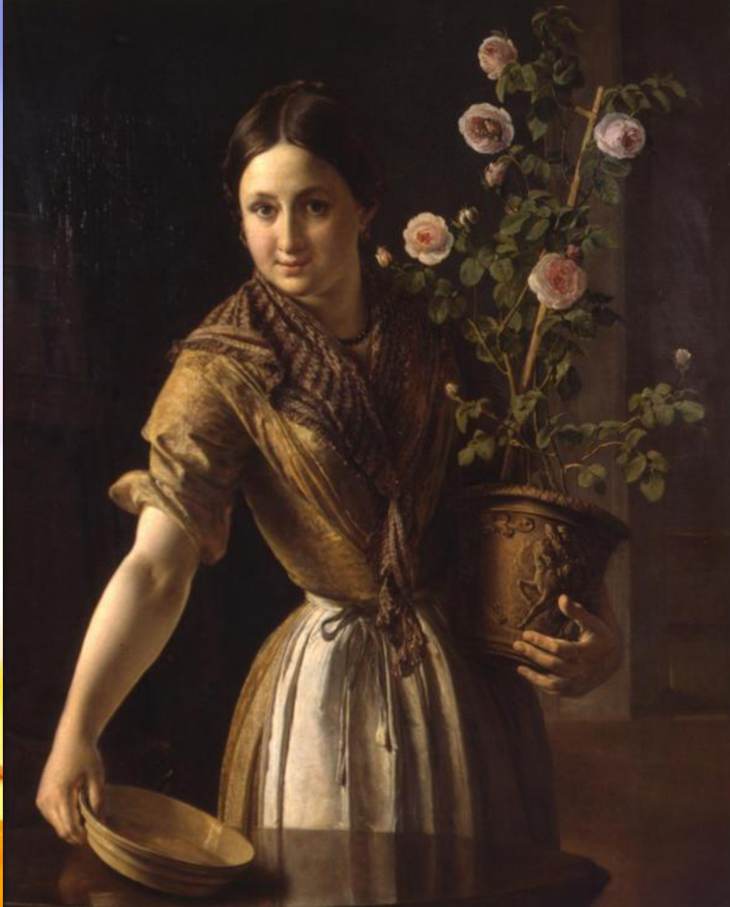
«Девушка с горшком роз»